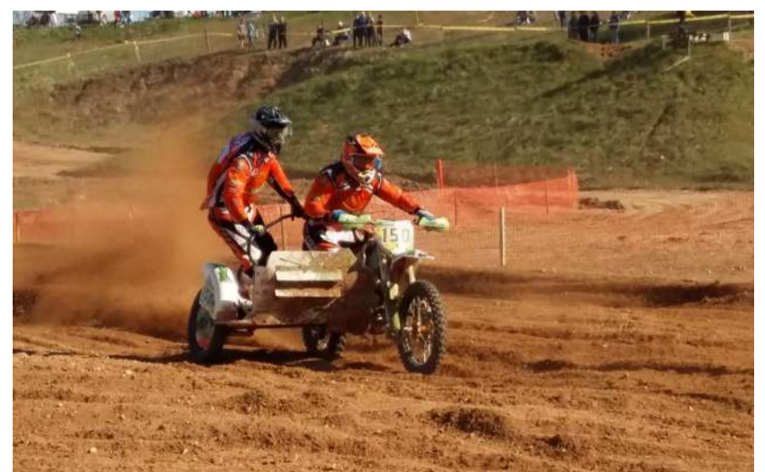
Rokiškėnų startų akimirkos.