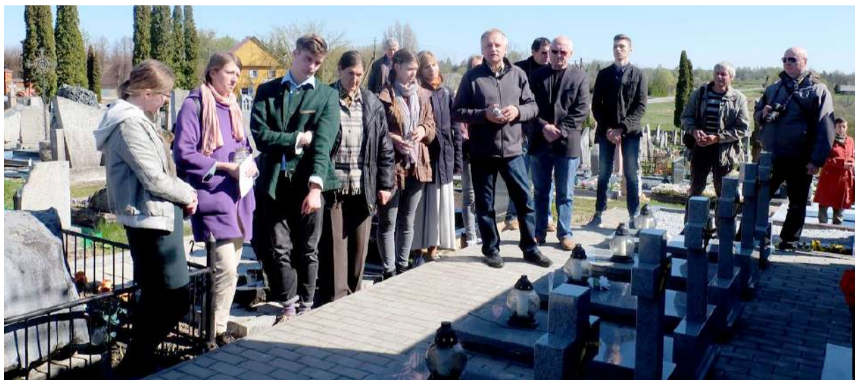
Sąskrydžio dalyviai įsiamžino prie Laisvės kovų muziejaus Obeliuose ir prie paminklo 1941 m. Birželio sukilimo bei sovietinės okupacijos aukoms atminti.