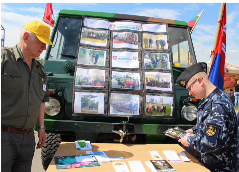
Karinių jūrų pajėgų karys susidomėjo lankstinukais apie Obelių laisvės kovų istorijos muziejų.

Šventės metu buvo galima susipažinti ir su rečiau matomais kariuomenės daliniais: logistikos specialistais, kariuomenės kartografijos ir leidybos specialistais, pamatyti, kaip specialia valymo įranga nukenksminamas vanduo. Įspūdingą pasirodymą surengė Juozo Vitkaus inžinerijos bataliono išminuotojai. Jie demonstravo specialaus roboto, skirto sprogmenims neutralizuoti,