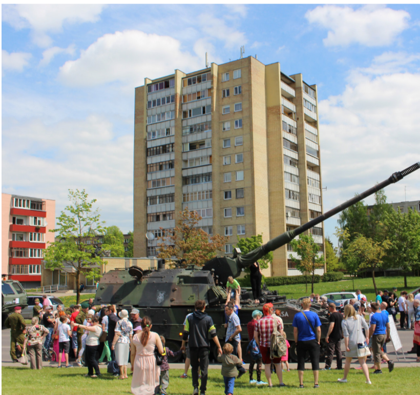
Vokietijos kariuomenės tankas „Leopard“ susilaukė didžiulio visuomenės dėmesio.

galimybes: įrenginys sugebėjo pripat dirvos nuskinti pienės žiedą taip, kad nesutraiškėtų stiebelio, ir jį įteikė mažajai demonstracijos žiūrovei. Įspūdingą pasirodymą žiūrovai sutiko audringais plojimais.