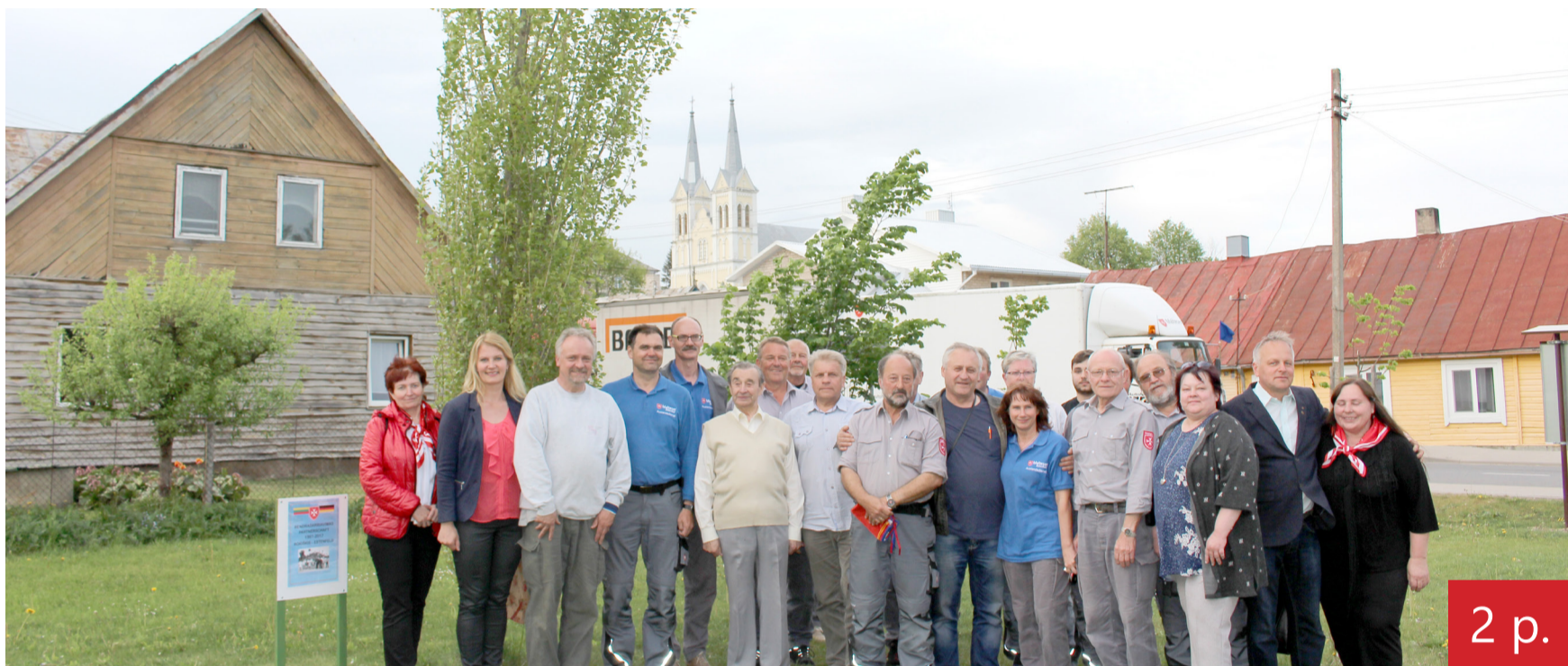
Vokiečių ir lietuvių draugystę įprasminantis medis jau seniai praaugo žmones.