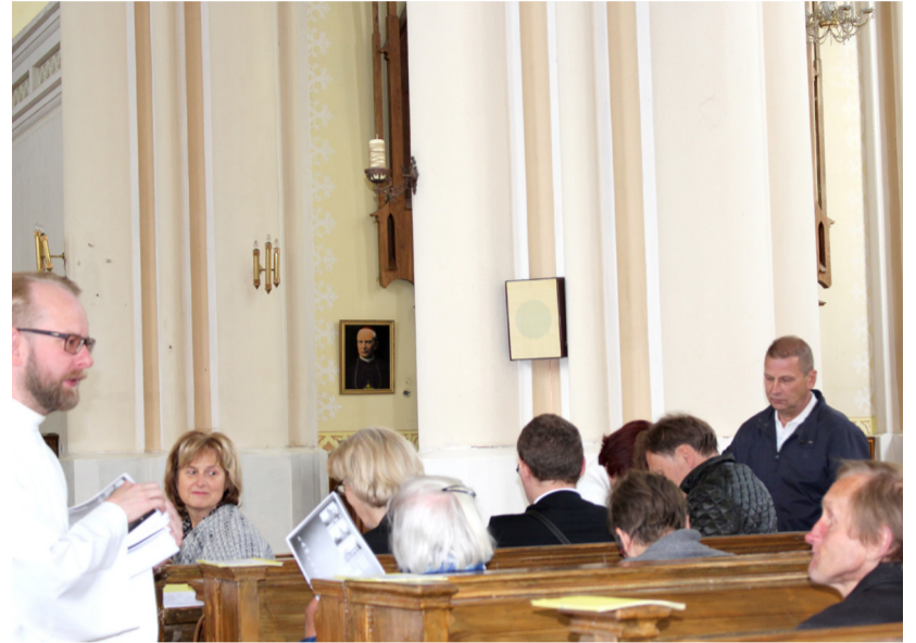
Dovana kamajūškiams – Kamajų katekizmas.