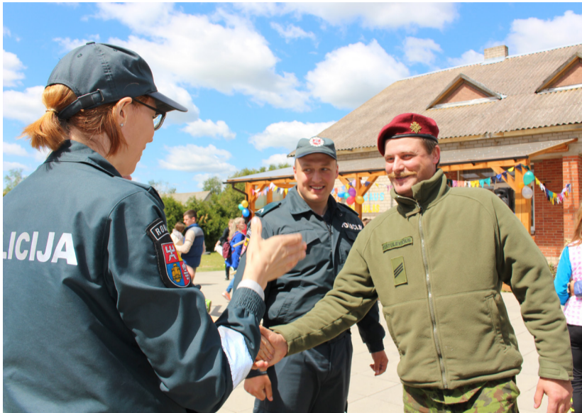
Šventės Lailūnuose svečiai – policijos pareigūnai ir kariai.

Norinčiųjų varžytis estafetėje buvo daug: užsiregistravo net dešimt komandų po tris asmenis: nuo vaikų iki tėčių ir mamų komandų. Siekiant