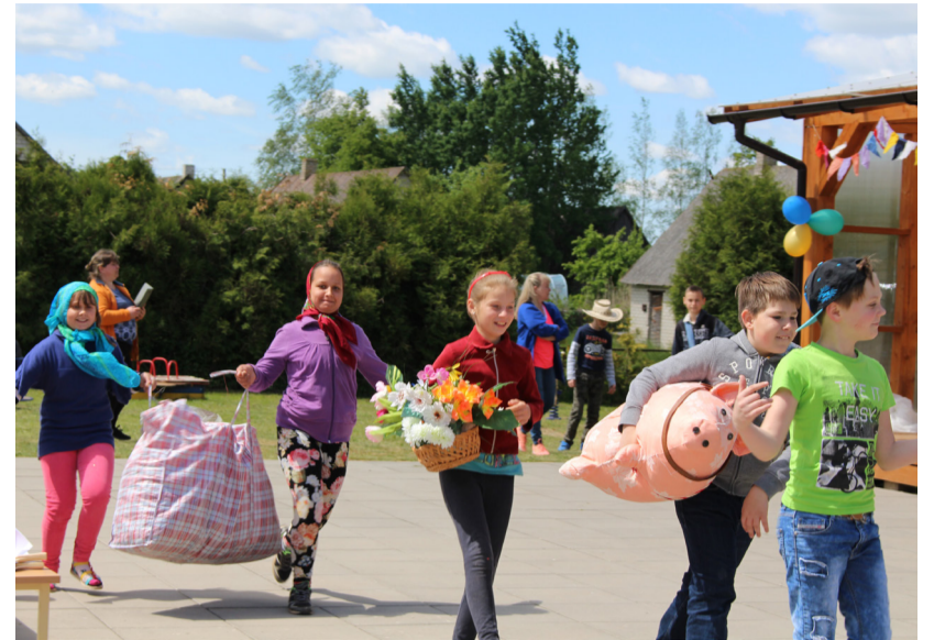
Lailūnų ir Martynonių vaikų linksmas pasirodymas.

Pasibaigus estafetėms, susumuoti jų rezultatai. Mamų komandai, iškovojusiai trečiąją vietą, teko po kareivišką sausąjį davinį. „Erelio akimis“