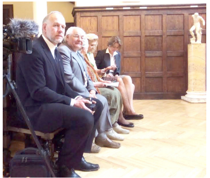
Susidomėjusių literatūrinės premijos pristatymu netrūko.

Po tokio jaudinančio dokumentinio filmo, žodį tarė buvęs Kupiškio rajono meras, Seimo narys Jo-