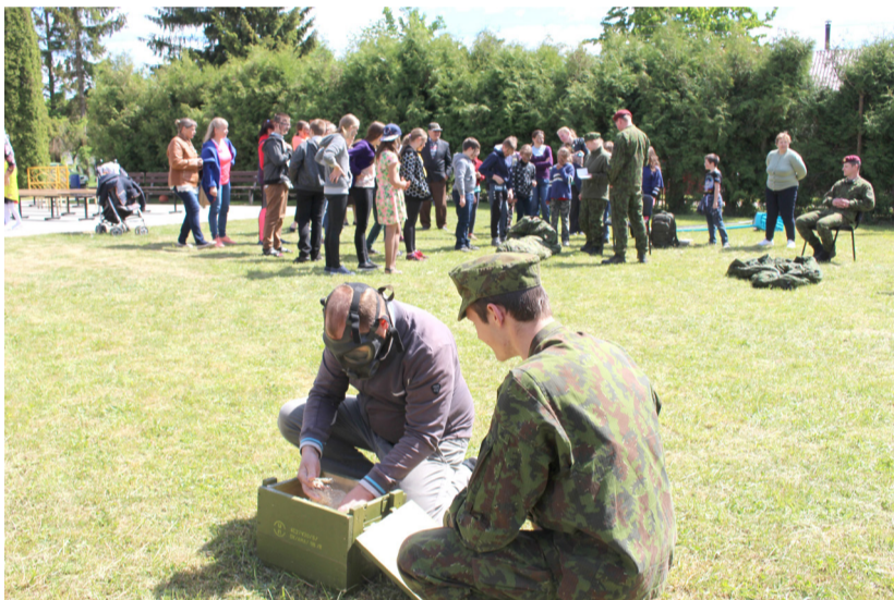
Viena estafetės rungčių – dėvinti dujokaukę pjuvenų pripildytoje dėžėje surasti tris šovinių gilzes.

sulyginti besivaržančiųjų galimybes, suaugusiųjų ekipoms savo „sužeistuosius“ teko nešti ilgesnį atstumą.