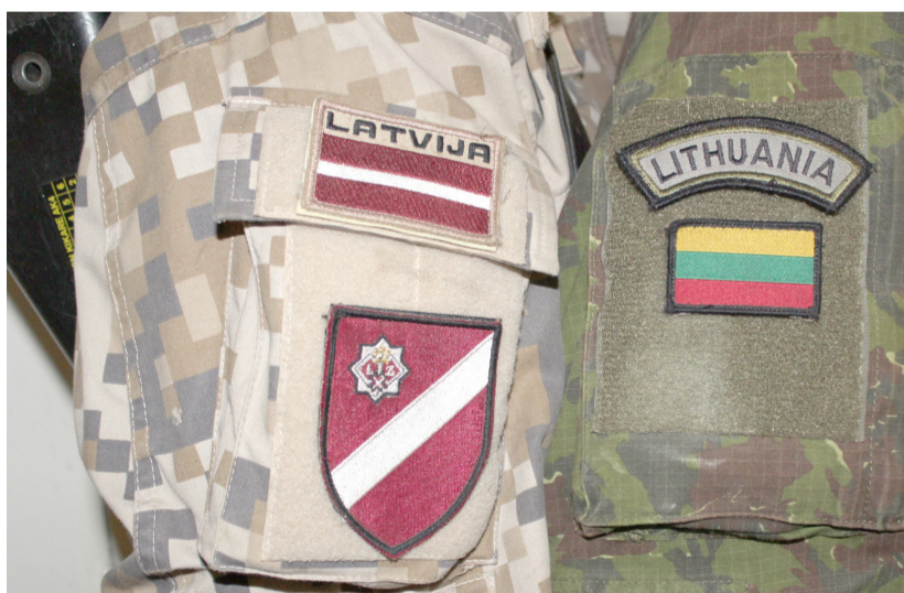
Nuotrauka, simbolizuojanti latvių ir lietuvių karių draugystę.