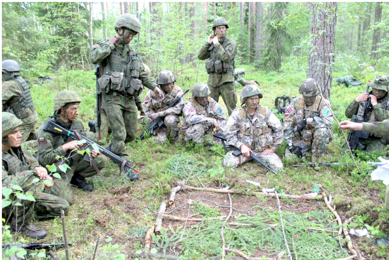
Lietuvių ir latvių kariai savanoriai mokėsi derinti bendrus veiksmus, planuoti operacijas. Kad tai vyktų sparčiau, pratybų metu buvo sudaryti bendri skyriai. Nuotraukoje – vienas iš skyrių planuoja operaciją.

Vienintelis didesnis skirtumas, kuris krito į akis, – uniformos: latviai vilki gerokai šviesesnes. „Jei mūsų miško prieblandoje tiesiog išnykdavo, susiliedavo su aplinka, tai latviai buvo gerokai pastebimi. Kaip mes juoka-