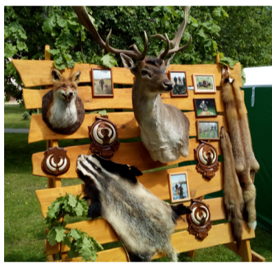
„Rokiškio Sirenos“ inform.

gais plojimais, kartu dainavo gerai žinomas dainas, poros sukosi nepavargdamos. Temstant grupė „EGO“ pakeitė merginų grupę iš Kauno „HIT“. Įspūdinga apranga spindinčios merginos dainavo ir gerai žinomas dainas, ir savo autorines bei mielai bendravo su susirinkusiais gerbėjais. Tris mergaites net pasikvietė ant scenos kartu padainuoti ir pašokti.