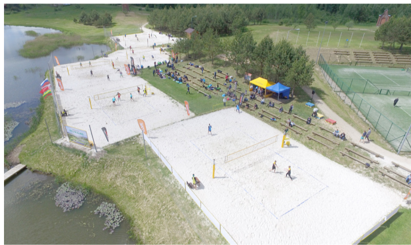
Varžybos iš paukščio skrydžio.