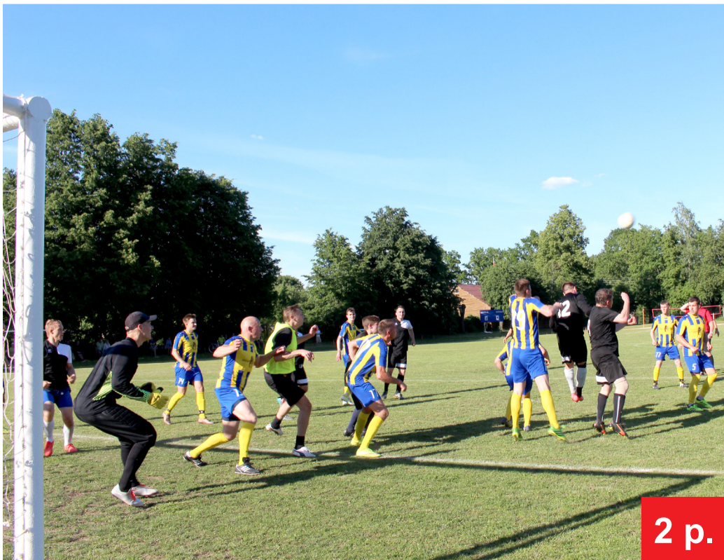
Rokiškio futbolo klubo žaidėjai (dryžuota apranga) paskutiniomis rungtynių minutėmis sėkmingai apgynė savuosius vartus ir įveikė vienus pirmenybių favoritų – Visagino „Inter veteranų“ komandą.