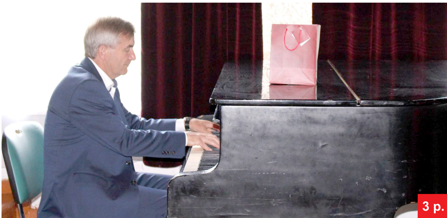
Obelių vaikų globos namuose Seimo pirmininkas Viktoras Pranckietis fortepjonu skambino trumpąjį muzikos kūrinį.