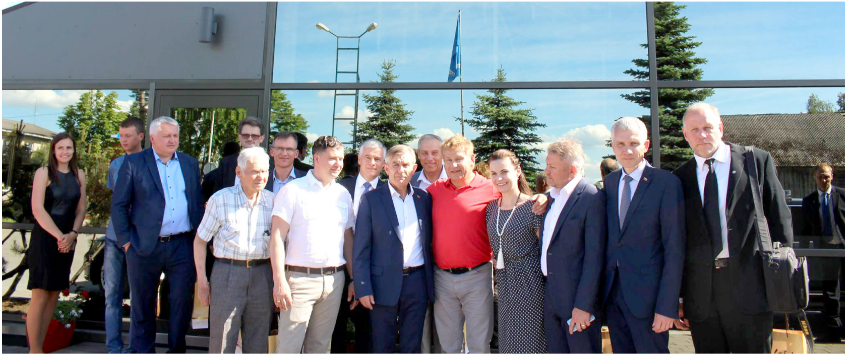
Seimo pirmininko susitikimo su Rokiškio rajono verslininkais UAB „Lašų duona“ dalyviai.