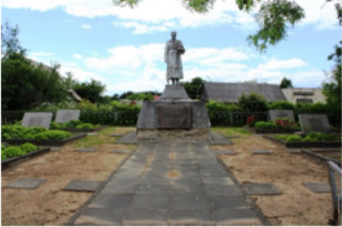
Antrojo pasaulinio karo Sovietų Sąjungos karių kapinės Rokiškio rajone.