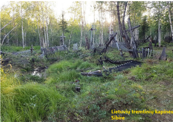
Lietuvių tremtinių kapinės Sibire