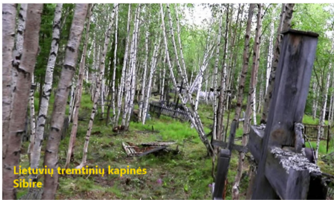
Lietuvių tremtinių kapinės Sibire