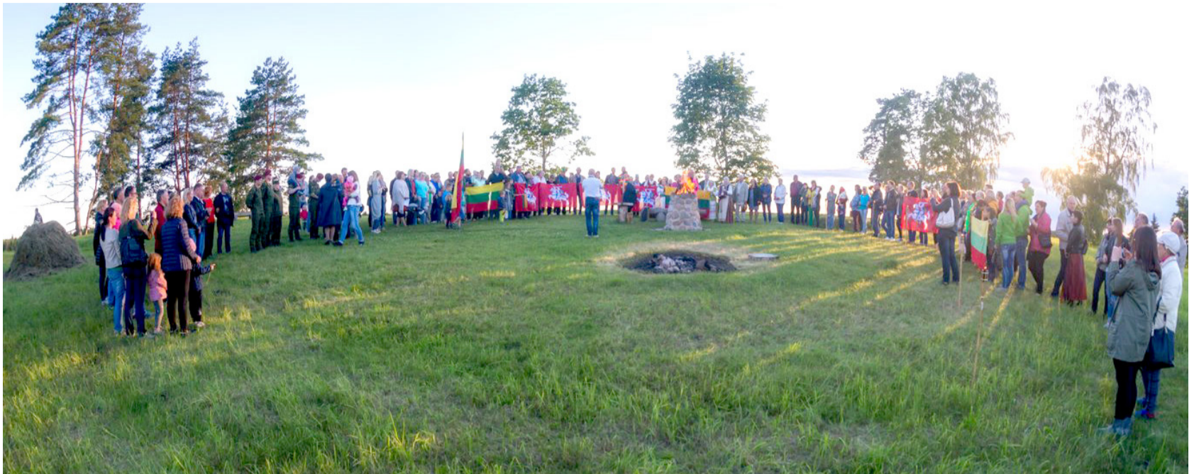
Moškėnų piliakalnio viršūnėje himną giedojo nemažai rokiškėnų: kariai, politikai, savivaldybės tarnautojai, miestelėnai.

Iki pat paskutiniosios rungties – kovų kalaviju ir mažuoju skydeliu