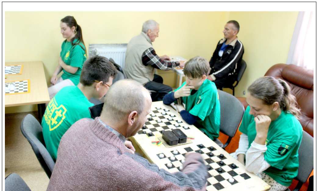
Valstybės dieną Obelių savarankiško gyvenimo namų gyventojai bei svečiai varžėsi šaškių turnyre.