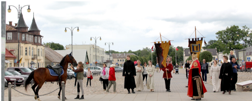
Karaliui Mindaugui paskutinius metrus iki sosto teko paėjęti, mat pasibaidė Princesė. Tačiau organizatoriai teigia, kad žirgas savo pareigą įvykdė.