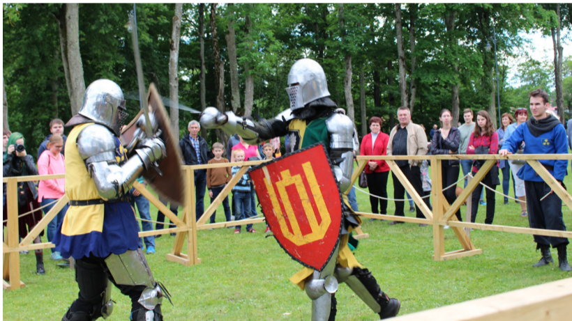
Riterių turnyro akimirka.