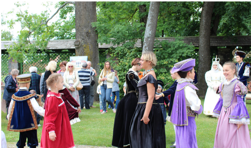
Renesanso šokių pamoka su „Ažuoliuko“ vaikais.

„buckleriu“ – nebuvo aišku, kuris iš likusių keturių riterių laimės turnyrą. Susumavus visų trijų rungtių rezultatus paaiškėjo, kad sėkmė nusišyp-