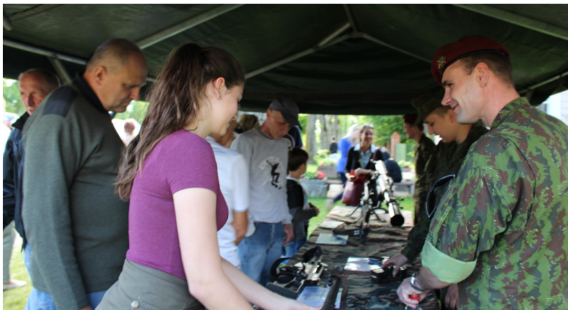
Rokiškėnų dėmesį traukė ne tik viduramžių, bet ir šiandieninė karių savanorių ginkluotė.