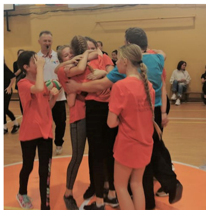
Senamiesčio progimnazijos merginų pergalės šokis.