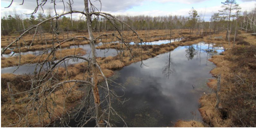
Sacharos pelkė Rokiškio rajone.