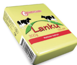
TEPIJŲ RIEBALŲ MIŠINYS LANKŲ, 72 %rieb. fas.