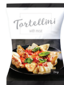
KOLDŪNAI SU MĖSA TORTELLINI, 1 kg