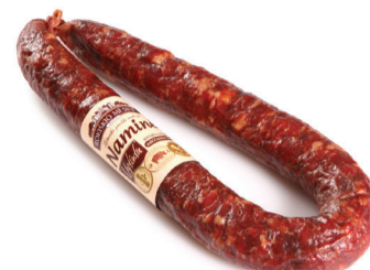
VYTINTA NAMINĖ DEŠRA

AKCIJA GALIOJA 2020.02.01 - 2020.02.29 VISOSE ROKIŠKIO MĖSINĖS FIRMINĖSE PARDUOTUVĖSE