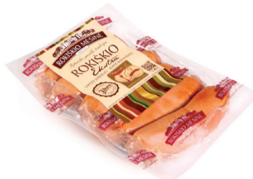
ROKIŠKIO EKSTRA SARDELĖS