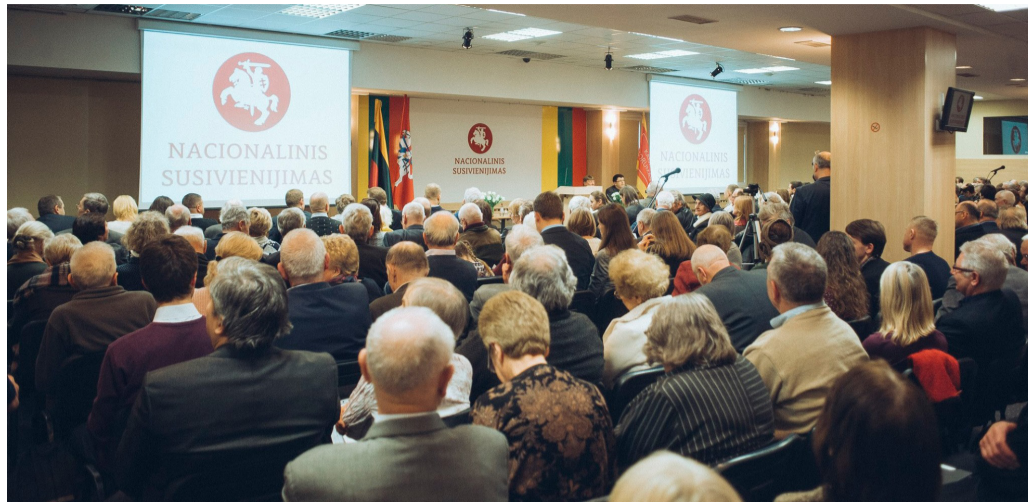
Steigiamojo suvažiavimo akimirka.

Jis neslėpė: sunku įveikti visuomenės nepasitikėjimą partijomis, judėjimais. Bet tą daryti reikia. „Ir tarp mūsų, rokiškėnų, yra daug žmonių, iki tol nedalyvavusių partijų veikloje. Vadinasi, jiems gali būti patrauklios „Nacionalinio susivienijimo“ idėjos“, – akcentavo pašnekovas.