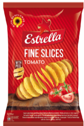
TRAŠKUČIAI ESTRELLA, 140 g įvairių rūšių