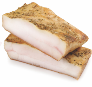
ROKIŠKIO LAŠINIAI, šaltai rūkyti

AKCIJA GALIOJA 2020.03.01 - 2020.03.31 VISOSE ROKIŠKIO MĒSINĖS FIRMINĖSE PARDUOTUVĖSE