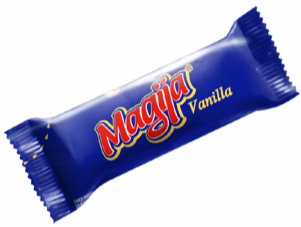
VARŠKĖS SŪRELIAI MAGIJA, 45 g įvairių rūšių