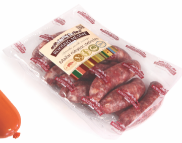
MAŽAI RŪKYTOS DEŠRELĖS