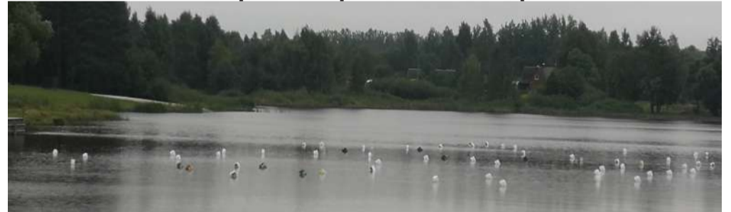
Vietoj batutų parko beliko jo vietą žymintys plūdurai.

Praėjusį ketvirtadienį, rugsėjo 10-ąją, buvo išardytas Rokiškio ežere visą vasarą veikęs batutų parkas. Ar pateisino jis lūkesčius?