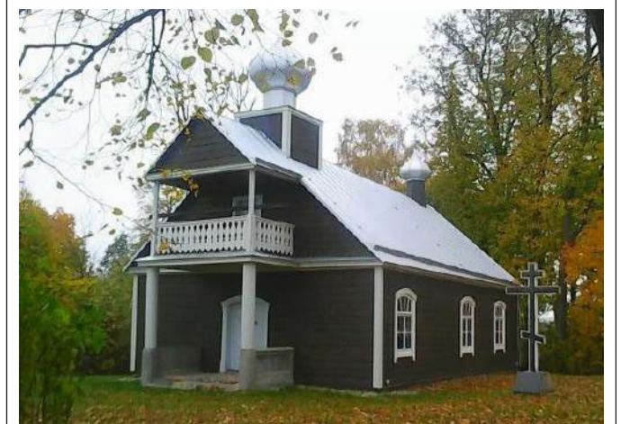
Rugsėjo 20 d., sekmadienį, 11.00 val. vyks pamaldos Bobriškio sentikių cerkvėje