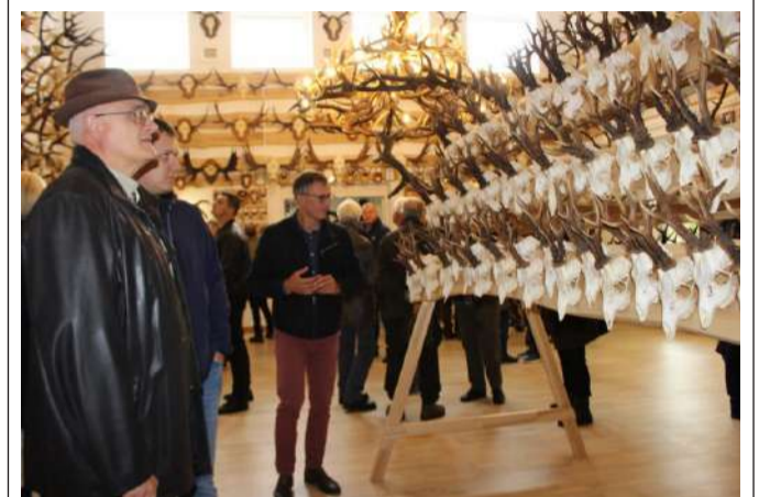
2020 m. rugsėjo 24 d. Rokiškyje, Laisvės g. 19 Lietuvos medžiotojų ir žvejų draugijos Rokiškio skyriuje pradeda veikti