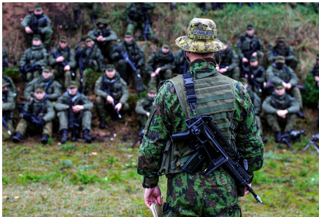
Pratybų aptarimo akimirka.

Už ką buvo įvertinti rokiškėnai kariai? Pavojingiausias buvo pirmasis užduoties etapas. Karius lengviausia pa-