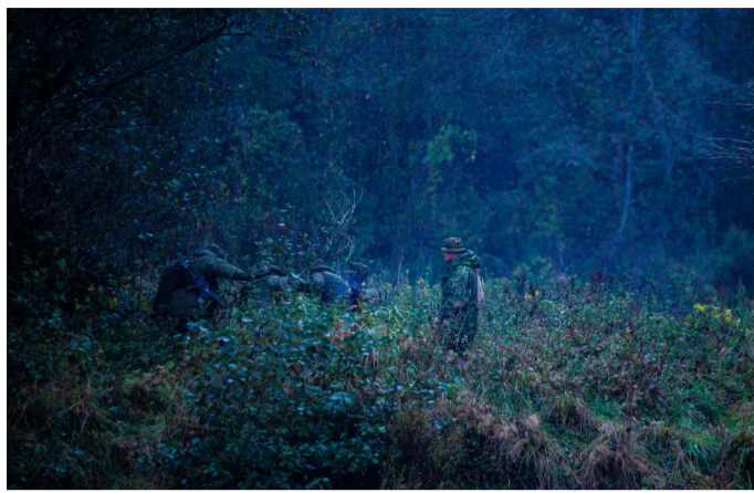
Pratybų akimirka: prieš veiklos imitavimo grupei pasalą rokiškėnai kariai paspėdė puikioje vietoje: ant tiltelio (nuotrauka kairėje): ten nėra kur atsitraukti ir sunku gintis. „Sunaikinę“ sunkvežimio keleivius, mūsiškiai kariai išnyko priešaurio rūke.

Gyventojų nuomonės tyrimai rodo, kad Lietuvos kariuomenė nuolat patenka į trejetuką Lietuvos valstybės institucijų, kuriomis pasitikima labiausiai. Gyventojų pasitikėjimo bei palankumo atmosfera lydėjo ir spalio 9-11 d. Obelių krašte vykusias Krašto apsaugos savanorių pajėgų Vyčio apygardos 5-osios rinktinės 506-osios pėstininkų kuopos ataskaitines vertinamąsias pratybas.