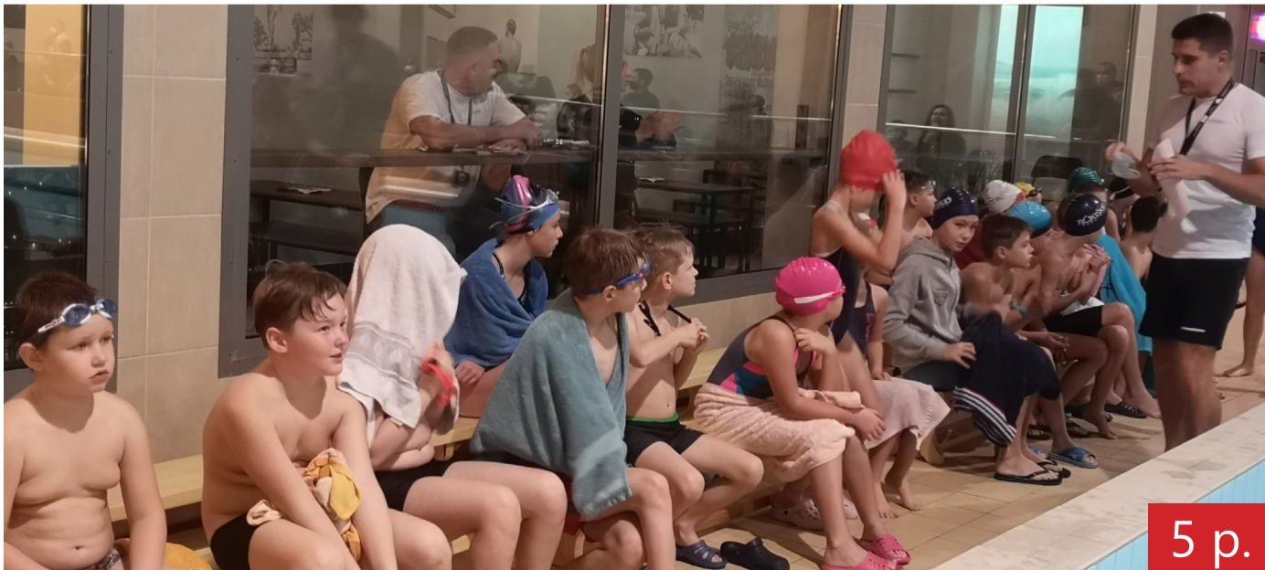
Varžybos besirengiantys jaunieji rajono plaukikai atidžiai klausė trenerio instruktažo.

Rokiškio baseinui – dveji: varžybos kiekvienam jaunajam plaukikui