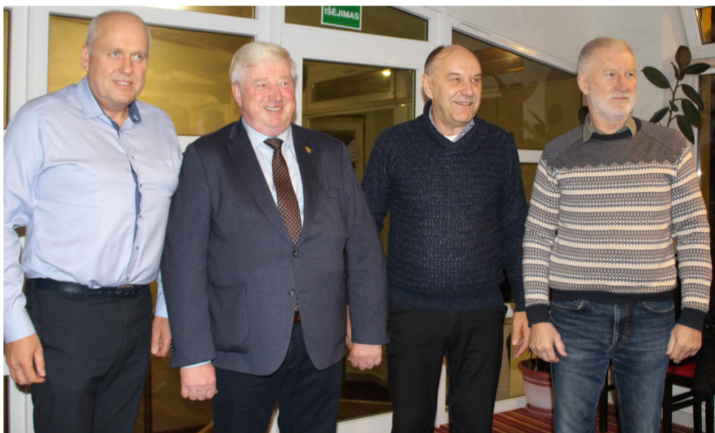
Pasveikinti nugalėtojo atvyko ir kupiškėnų delegacija.

Aktyvumo rekordas priklauso Skemų rinkiminei apylinkei: čia jau balsavo kiek daugiau nei penktadalis balsavimo teisę turinčių asmenų. Tai neturėtų stebinti: iš 652 rinkėjų iš anksto balsavo 19, o dar 112 – specialia me punkte. Iš anksto net 415 rinkėjų balsavo Respublikos rinkimineje apylinkėje (tai sudaro 17,15 proc. visų jos sąrašuose esančių rinkėjų). Visose Rokiškio miesto didžiosiose rinkimų apylinkėse iš anksto balsavusiųjų skaičius viršija 12 proc. Iš mažiausių apylinkių nekantriausiu yra Konstantinavos rinkėjai – iš 128, esančių sąrašuose, jau balsavo 17, arba 13,28 proc. Mažiausiai balsavusiųjų iš anksto yra Čedasų apylinkėje – vos du, arba 1,2 proc. Ne ką gausiau balsavo ir Lailūnų rinkėjai: čia išankstinio balsavimo aktyvumas yra 2,03 proc. Vos 3 proc. ribą peržengė ir didelės Kamajų apylinkės, taip pat Salų, Duokiškio