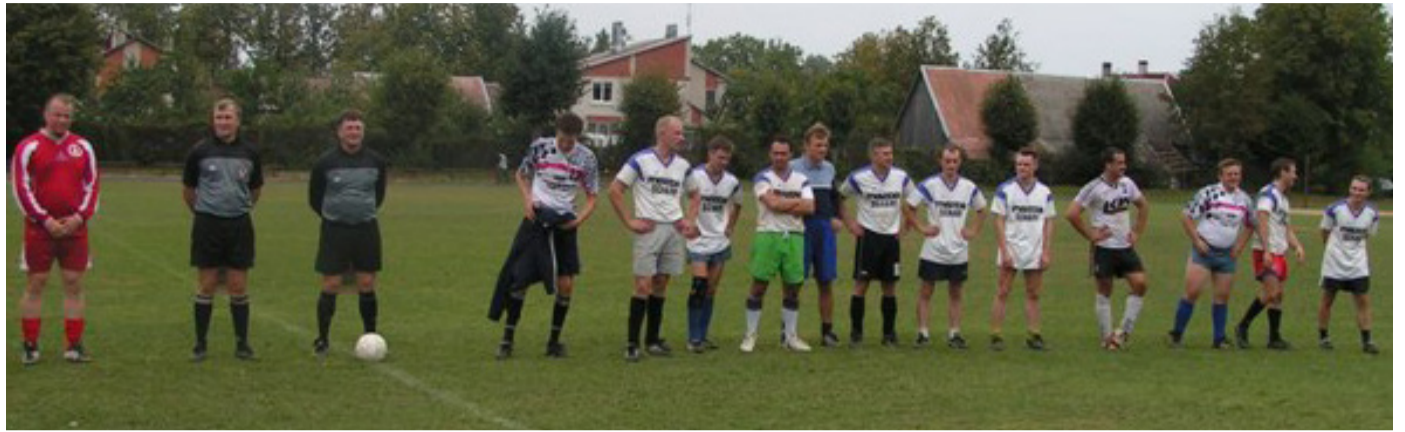
Rungtynės su sostinės pramogų žvaigždžių ekipa „Prelegentai“ paskatino futbolo entuziastus burtis į klubą.

Pergalė Aukštaitijos čempionate Rokiškio futbolo klubo komandai galėjo tapti ženkliai augimo postūmiu. Mat tuo pačiu buvo iškovotas kelialapis į šalies II lygą. Deja, istorinė galimybė buvo praleista. Ne dėl ekipos kaltės. Šiuo metu rajone yra trys futbolo stadionai – Kūno kultūros ir sporto centro, Juozo Tumo-Vaižganto gimnazijos „Romuvos“ padalinio bei Pandėlio gimnazijos. Atr-