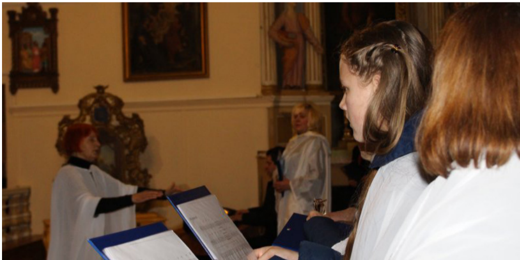
Šv. Cecilijos šventė jungia kelias giedotojų kartas. Kadras iš pernykštės šventės Pandėlyje.

klauptuose sėdėdavo skirtingų parapijų tikintieji, tad repeticijos metu būdavo proga susipažinti, pabendrauti. Po repeticijos – šv. Mišios, kuriose giedodavo jungtinis visų šventės dalyvių choras, o šv. Mišias aukojo parapijų, atsiuntusių choras, dvasininkai. Po šv. Mišių būdavo pagerbiami nusipelnę choristai, chorų vadovai. Ir, žinoma, paskelbiama, kur bus rengiama kita šv. Cecilijos iškilmė. Po to būdavo tradicinė šventės dalyvių vakarienė, kurioje netrūko smagaus bendravimo.