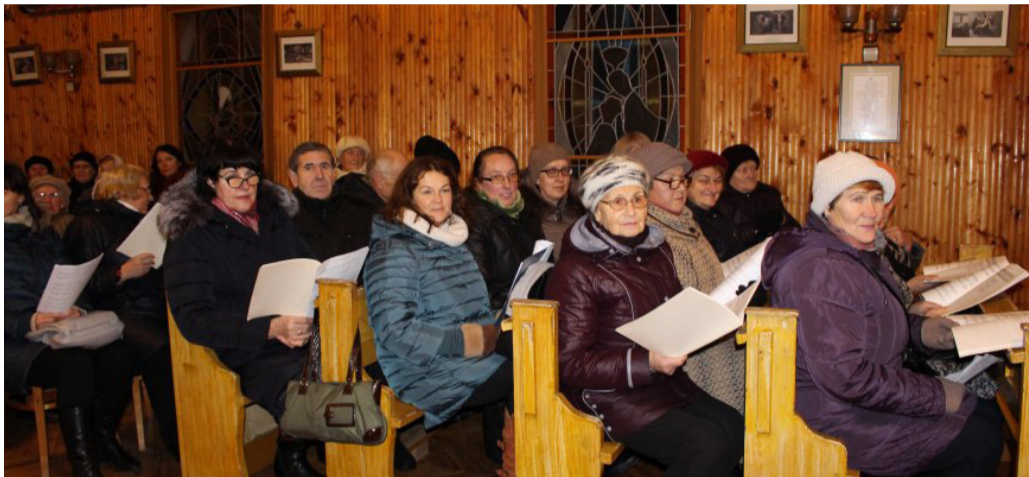
Džiugi įvairių parapijų chorų giedotojų nuotaika Juodupės bažnyčioje.

Jie šventės dieną giedodavo ne ant viškų, kaip įprasta, bet pačioje bažnyčioje. Šalia