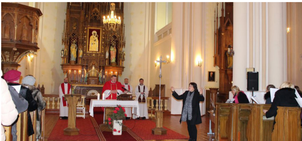
Pirmosios šv. Cecilijos šventės Kamajuose akimirka.