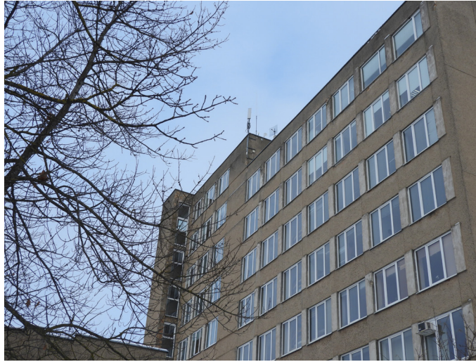
Smulkaus ir vidutinio verslo plėtros programai rajono savivaldybė šiemet skyrė 70 tūkst. Eur. Tikimasi, kad ir ateityje ši parama nemažės.

Tačiau, kaip jau minėta, ši parama nėra gelbėjimosi ratas skęstantiesiems, ir remti į sunkumus patekusioms įmonėms rajono biudžeto pinigai nešvaistomi. Į paramą pretenduojantys verslo subjektai atidžiai tikrinami ne tik pateikus dokumentus, bet ir dvejus metus po paramos gavimo. Nors ankstesniais metais, svarstant lėšų paramai verslui skyrimą, rajono politikai klausė rajono savivaldybės administracijos direktoriaus, kiek bankrutuojančių įmonių gavo lėšų, jis gali atsakyti drąsiai – tokių nėra. Buvo patikrintos devynios įmonės: visos jos sėkmingai veikia. Taip pat tvarkingai ir laiku buvo pateiktos parama pasinaudojusiu įmonių atas-