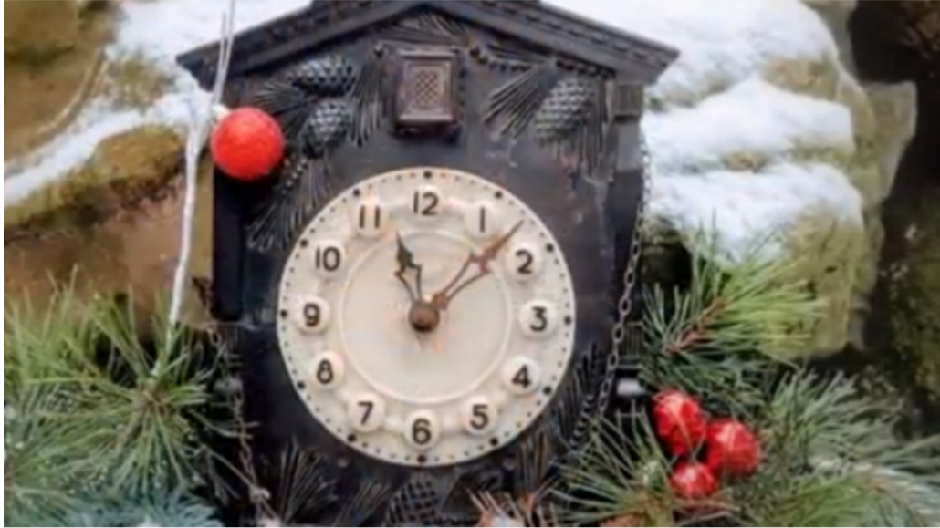
Nuotrauka konkursui „Pagauk akimirką žavingą“.