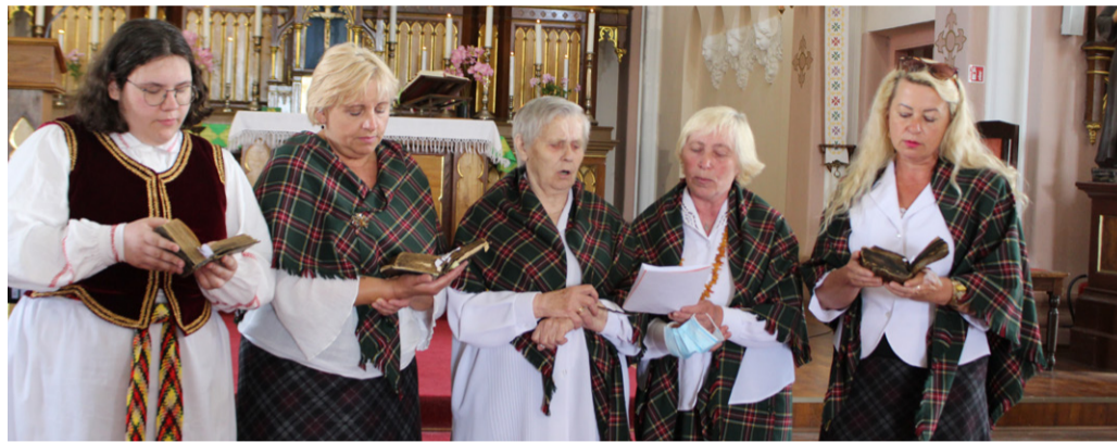
Kriaunų moterys pristatė unikalią paveldą – kantičkinės giesmes.