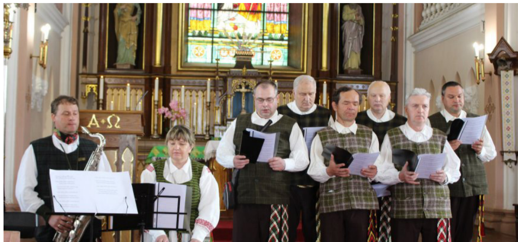
Itin pastebimas šventės šeimininkų – Skemų giedotojų – progresas.

Kaip pasakojo Prūdiškių socialinės globos namų direktorius ir darbuotojai, šventė prasidėjo dar gerokai anksčiau, nei autobusiukas pasuko į Obelius. Tikra atgaiva buvo karantino laikotarpiu, kai stigo elementaraus bendravimo, išpūdžių mokyti giedoti su viltimi, kad giesmė kada nors skambės šventovėje. O ir kelionė į Obelius dovanojo daug smagių mielų smulkmenų: