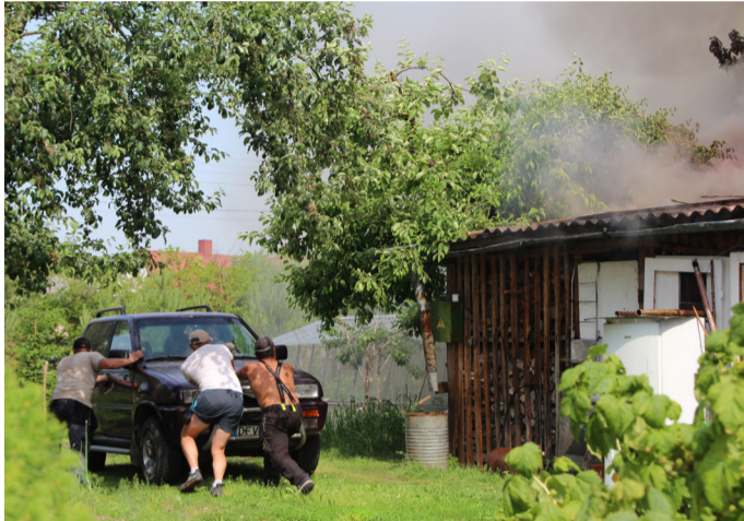
Kaimynai išstūmė toliau nuo ugnies šeimininkų automobilį.

jungė prie kolegų ir padėjo gesinti gaisrą: žarnomis liejo vandenį, padėjo nešti kopėčias, keitė kvėpavimo įrangai deguonies balionus. Seneliui paprašius išgelbėti prie malkinės pastatytą mašiną, paaiškėjo, kad jos rakteliai