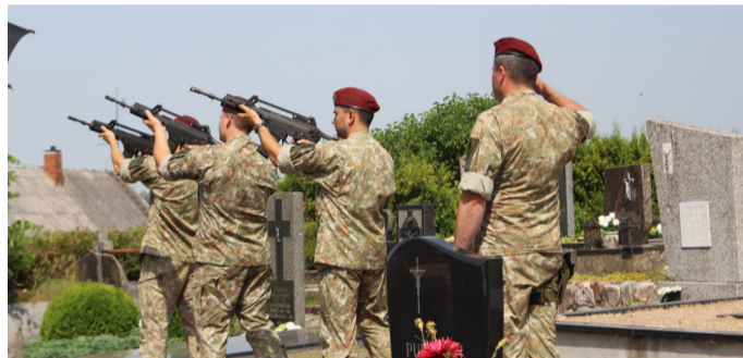
Krašto apsaugos savanorių pajėgų Vyčio apygardos 5-osios rinktinės 506-osios pėstininkų kuopos karių iškilminga salvė Juodupės kapinėse.