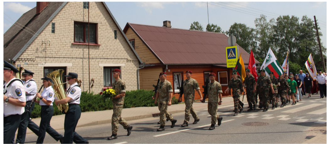
Eisena į Obelių kapines prie Birželio 23-osios sukilėliams ir sovietinio teroro aukoms atminti paminklo – bene vienintelio tokio Lietuvoje.