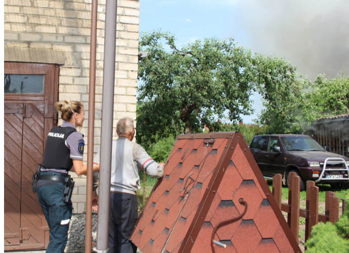
Policijos pareigūnė rūpinosi senjoru namo šeimininku.

Namo išsaugoti nepavyko Jau atvykus ugniagesiams,