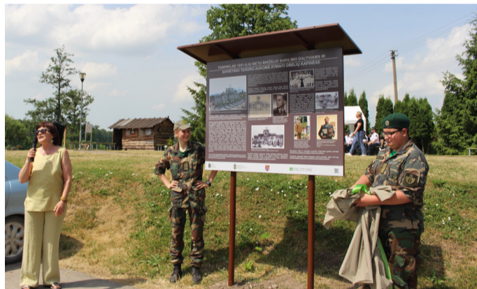
Birželio sukilimo istoriją obeliečiams ir miestelio svečiams pasakos Laisvės kovų istorijos muziejaus kieme atidengtas stendas.