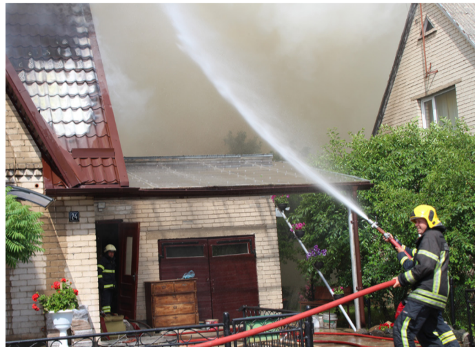
Ugniagesiai kelias valandas gesino namą.