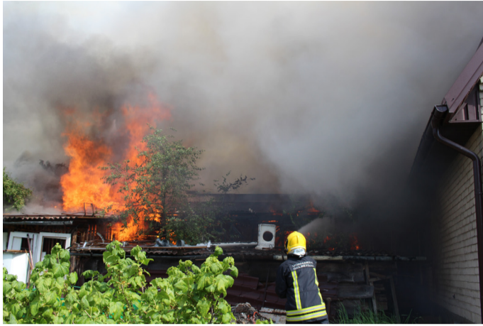
Gaisras kilo ūkiniame pastate-malkinėje.

Gaisras, kaip įprasta, sutraukė gausų būrį smalsuolių. Tačiau vyrai nesėdėjo rankų sudėję. Kaimynai ungiagesiai, kuriems tądien buvo laisvadienis, iš karto pris-