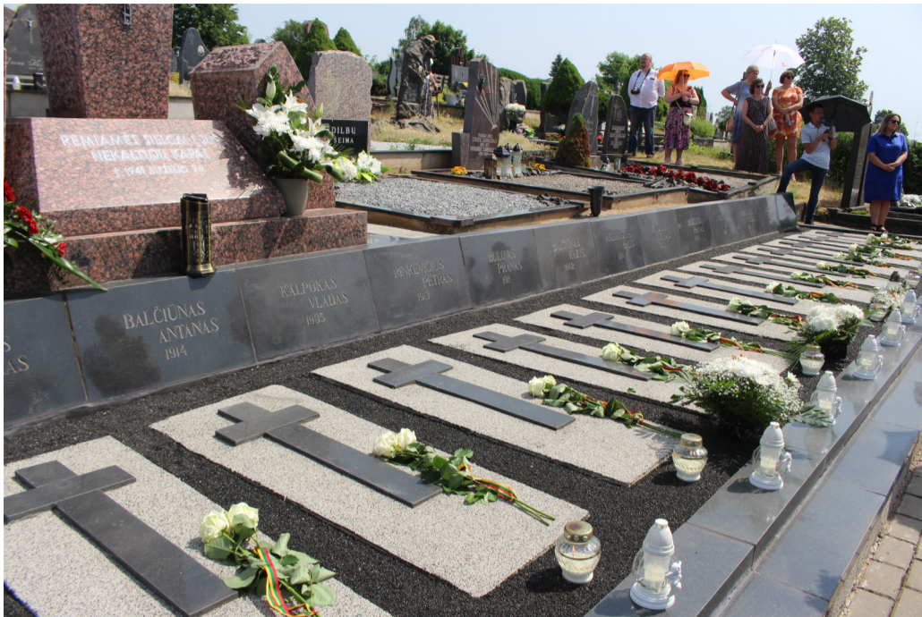
Memorialas Juodupės kankiniams.

Birželio 23-oji – viena sudėtingiausių ir kontraversiškiausių vertinamų Lietuvos naujosios istorijos datų. Tai ir sukilimo prieš sovietinę okupaciją pradžia. Skirtingai nei daugelis anksčiau, šis sukilimas buvo sėkmingas: faktiškai visoje Lietuvoje sukilėliams pavyko užimti valdžią. Deja, valstybingumo išsaugoti nepavyko: sovietinį okupantą pakeitė nacistinė Vokietija taip pat buvo nesuinteresuota nepriklausoma Lietuva. Atrodo, turėtume progą didžiulius. Tačiau dėl kai kurių sukilėlių galimų sąsajų su netrukus prasidėjusiu Holokaustu, Birželio sukilimas pamažu tampa nepageidaujama data Lietuvos kalendoriuose. Ir tai buvo juntama 80-ųjų sukilimo minėjimo metinių metu. Mūsų krašte Birželio sukilimo 80-osios metinės minėtos bene išpūdingiausiai. Tai nenuostabu: Obeliuose stovi entuziastų ir visuomenės lėšomis atstatytas bene vienintelis paminklas Birželio sukilimo dalyviams ir sovietinės okupacijos aukoms atminti. O Juodupėje – sava, su Rainių žudynėmis lyginama tragedija: čia sovietiniai aktyvistai nukankino 13 jaunų miestelio vyrų.