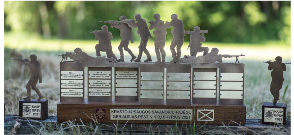
KASP geriausio skyriaus varžybų prizas.