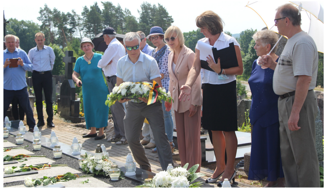
Juodupėje žiauriai nukankintų šio krašto žmonių atminimą pagerbė artimieji, Seimo nariai, Juodupės gimnazijos ir miestelio bendruomenė, rajono sąjūdiečiai.