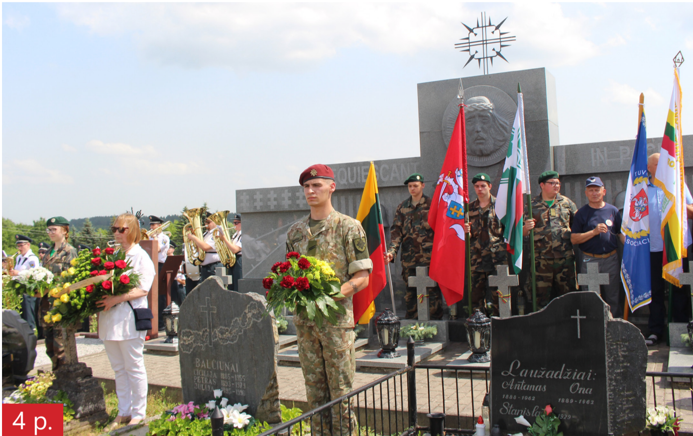
Birželio sukilimo minėjimo prie bene vienintelio šiam sukilimui skirto paminklo Lietuvoje akimirka.