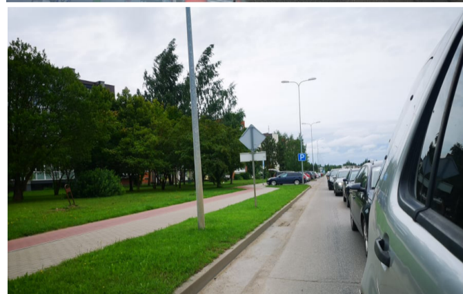
Judriausioje miesto arterijoje... suformuome kamščį.