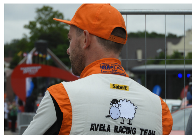
Su Petru Šiaučiūnu rokiškėnai kalbėjo ne tik apie ralį.

turi ką pasiūlyti Rokiškio atributikos prisiminimui apie ralį norintiems įsigyti: yra ir naujo dizaino puodelių, šratinukų, užrašinių.