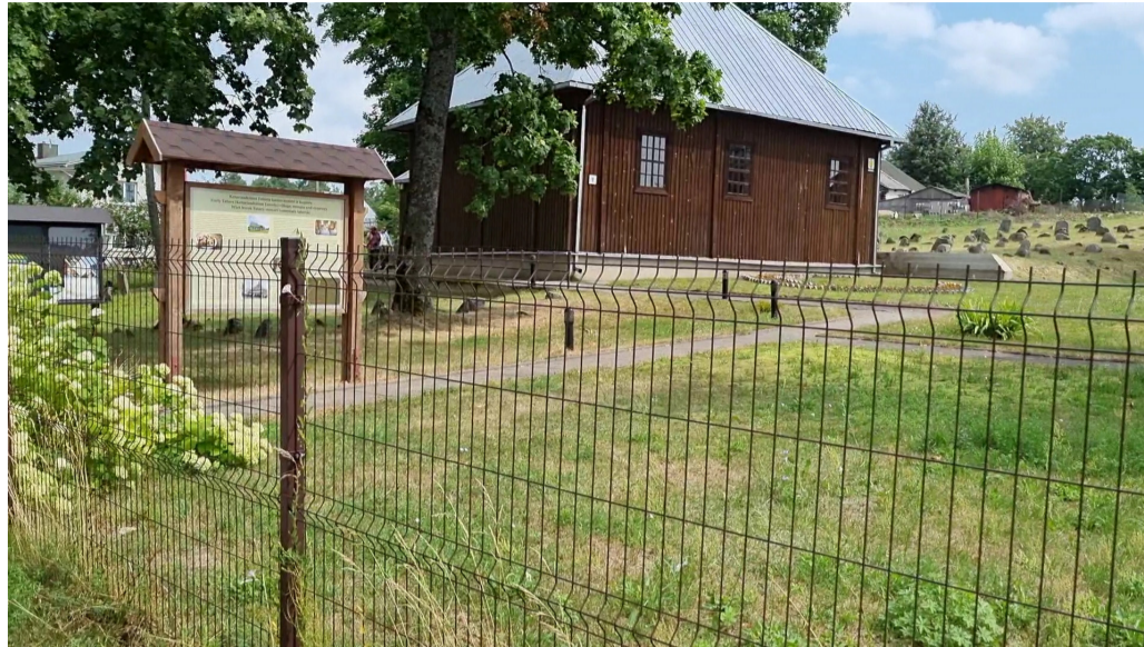
Keturiasdešimties totorių kaimas

Mažame Bareikiškių kaime stovi XIX a. medinis