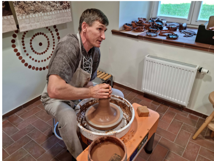
Tradicinių amatų centras Houvalto dvare