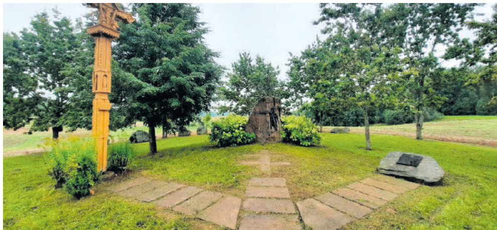
Istorinės atminties vieta Vaičėnų kaimui atminti.