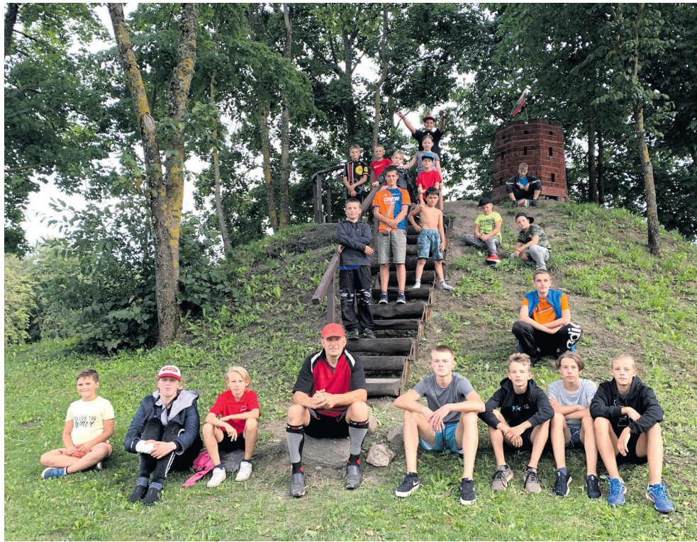
... ir atradimų džiaugsmą.

Juk kas atsisakys galimybės palenktyniauti Uljanavos trasoje, kurioje vyksta Lietuvos motokroso varžybos? Arba kas atsisakys pažinti Rokiškio apylinkių kelius, takus, kraštovaizdį? Pabendrauti ir pasivaržyti su bendraamžiais?