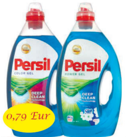
Skalbimo gelis Persil color 60 sk. 3 l, 2 rūšių.