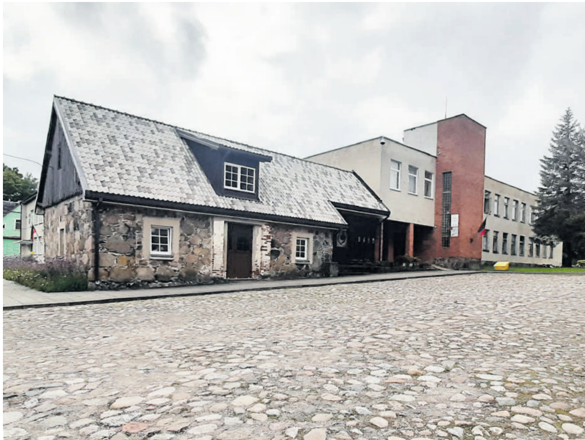
Jei prakalbėtų, daug pasakytų senoji Kamajų aikštė.

bernavo, o paragavęs mokslų pas jėzuitų vienuolius ir pasižymėjęs kaip gabus jaunuolis, vėliau Varniuose baigė kunigų seminariją ir buvo išventintas į kunigus. Dvasininko kelias nesušvelnino jo tiesmukiško charakterio, kuris pradėjo formuotis labai anksti. Pasakojama, kad kunigas sunkiai sutaręs su vyresnybe, bet puikiai rasdavęs kalbą su paprastais vietiniais žmonėmis. A. Strazdo išskirtinis būdas, tiesos režimas į akis, artimas bendravimas su paprastais žmonėmis erzino kunigų luomą. Nepritapusį prie sutanos brolių kunigą kilnojo iš vienos vietos į kitą, Aukštaitijoje jis pakeitė daugiau nei 20 parapijų.