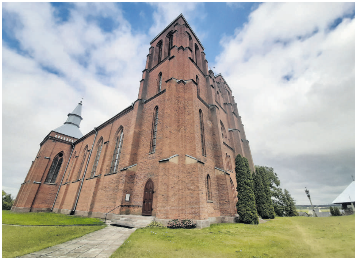
Pravažiuojančiųjų akį traukia miestelio puošmena – Šv. Kazimiero bažnyčia

Viena labiausiai Kamajus išgarsinusių asmenybių – lietuviško žodžio pradininkas, poetas, kunigas, o tuo pačiu maištininkas Antanas Strazdas, praleidęs miestelyje paskutinius savo gyvenimo metus. A. Strazdas gimė 1760 m. Margėnų kaime baudžiauninkų šeimoje. Piemenavo,