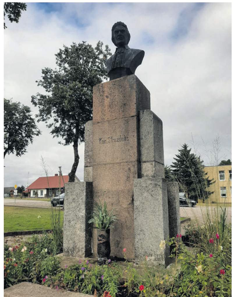
Paminklas A. Strazdui pastatytas už žmonių suaukotas lešas.