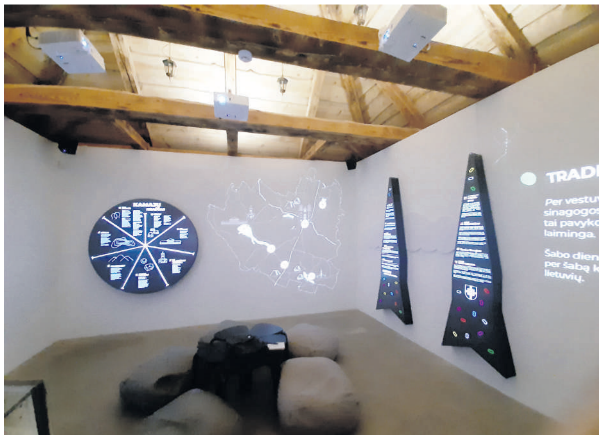
Istorija pasakojama pasitelkus šiuolaikines technologijas.