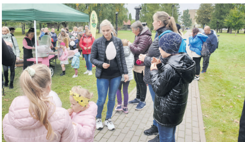
Mamų klubo palapinėje laukė smaližiautojų.