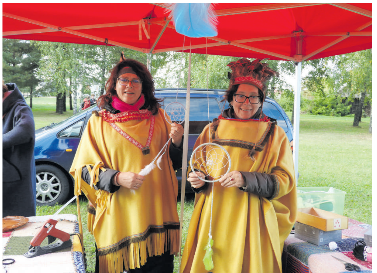
JAV atstovaujanti „indėnė“.