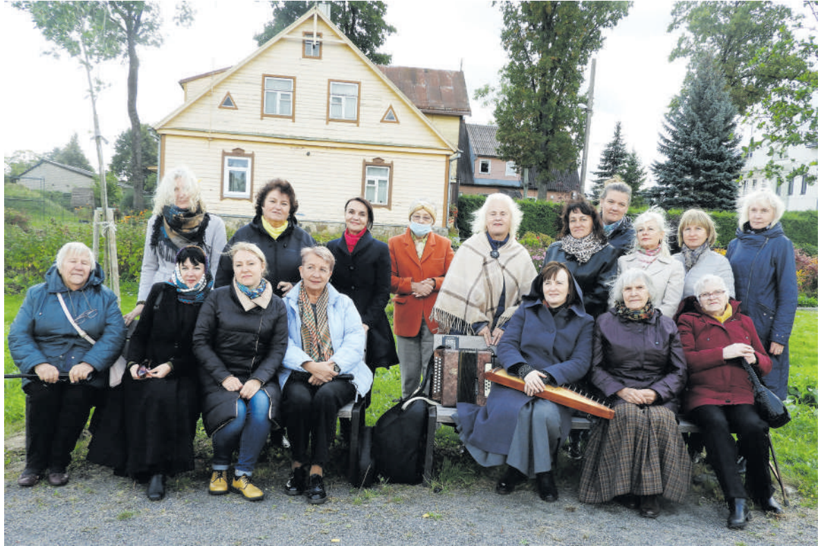
Skaitovai ir poezijos mylėtojai – vienoje vietoje.

Kalbančių, skambančių ar tiesiog šiaip gyvybę parodančių suoliukų idėjai buvo reikalingos lėšos. Finansiniai rėmėjai – Rokiškio rajono savivaldybė, pritarusi projektui, lėšas skyrusi Lietuvos kultūros taryba. Projekto biudžetas buvo nedidelis, tačiau šiai idėjai jo užteko, nes rasta visuomeniškų pagalbinių bei konsultantų. Skaitymus įgarsin-