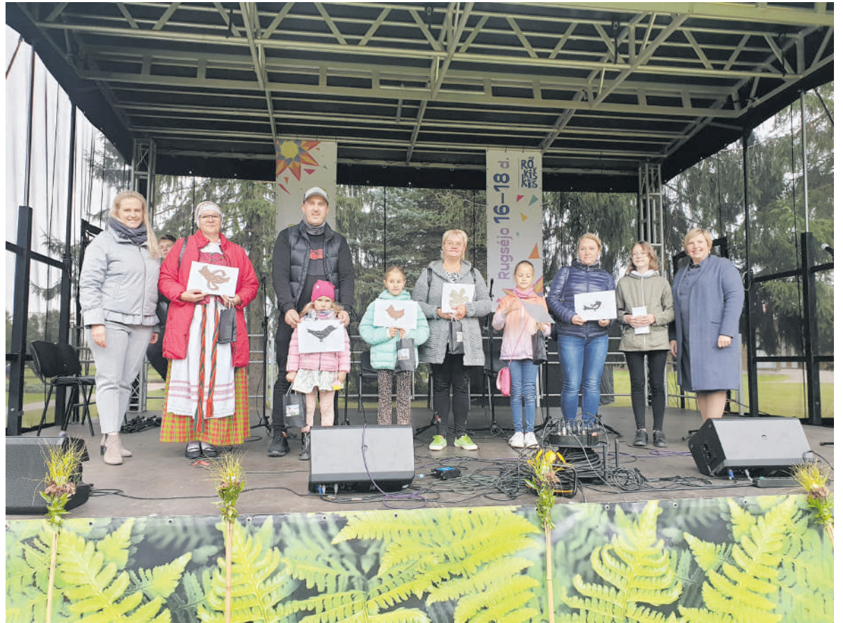
Apdovanoti karpinių varžytuvių dalyviai.

Miesto gimtadienis baigėsi, iki susitikimų kitais metais.