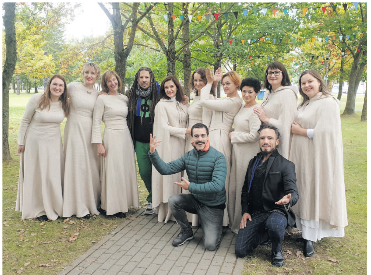
Vokalinė grupė Bella Fa.