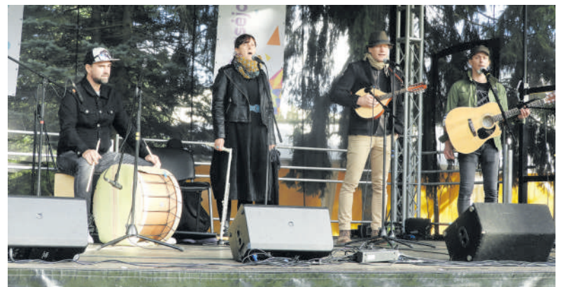
Scenoje – vengrai.