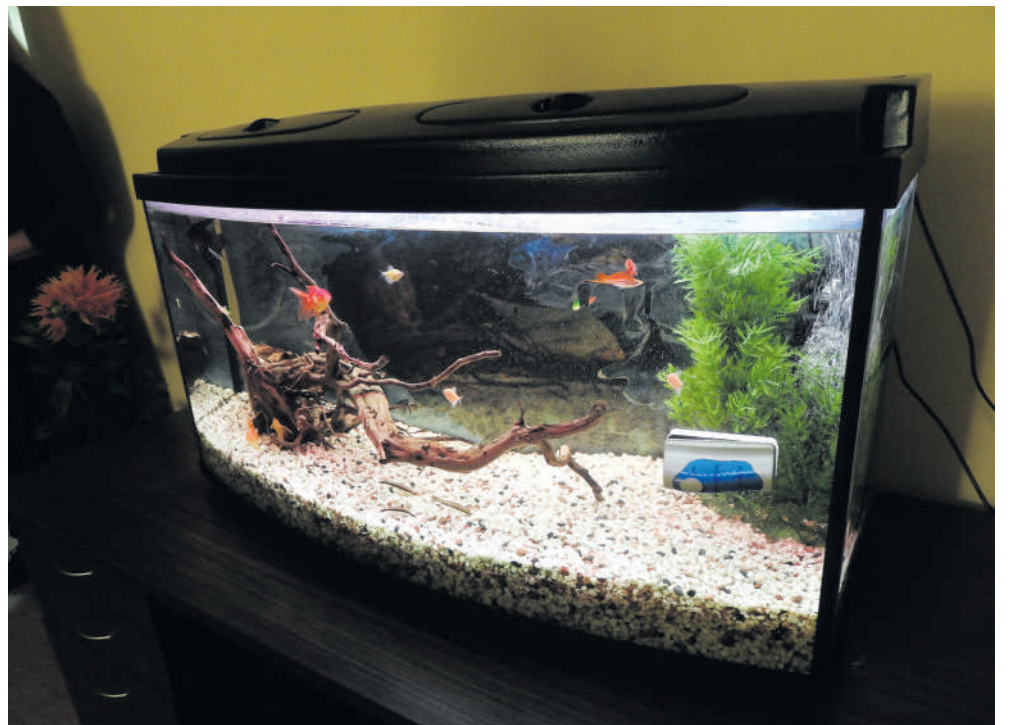
Jaukumą kuria akvariumas.