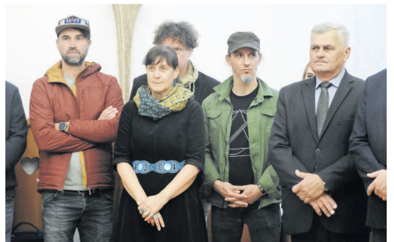
Sutarties pasirašymo ceremoniją stebėjo rajono politikai ir savivaldybės darbuotojai.

gestais, dovanomis. Dubno miesto meras išreiškė lūkestį, kad ir kitų sutarties pasirašyme dalyvavusių miestų atstovai bendradarbiaus su Ukrainos miestais.