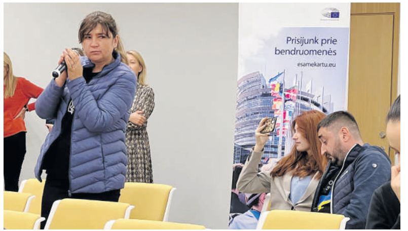
Apdovanojimuose dalyvė ukrainietė dėkojo Lietuvai už visokeriopą paramą.