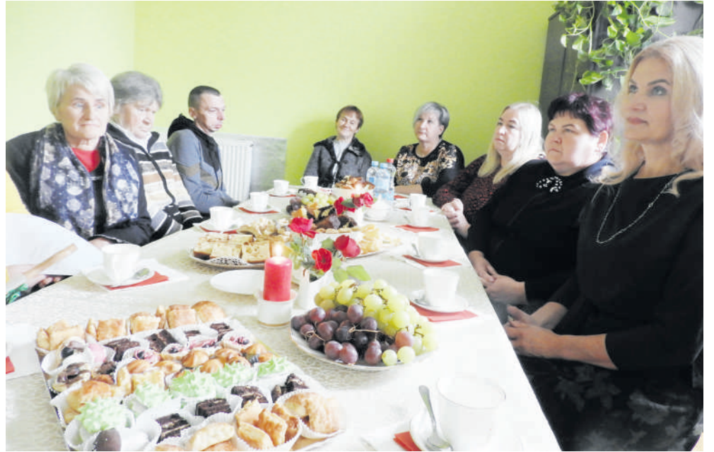
Prie bendro stalo.