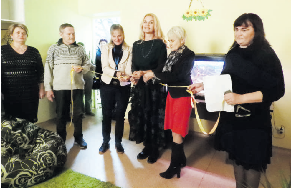
Perkirpta simbolinė atidarymo juostelė.