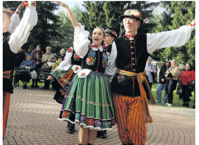
Šoka lenkų ansamblis.