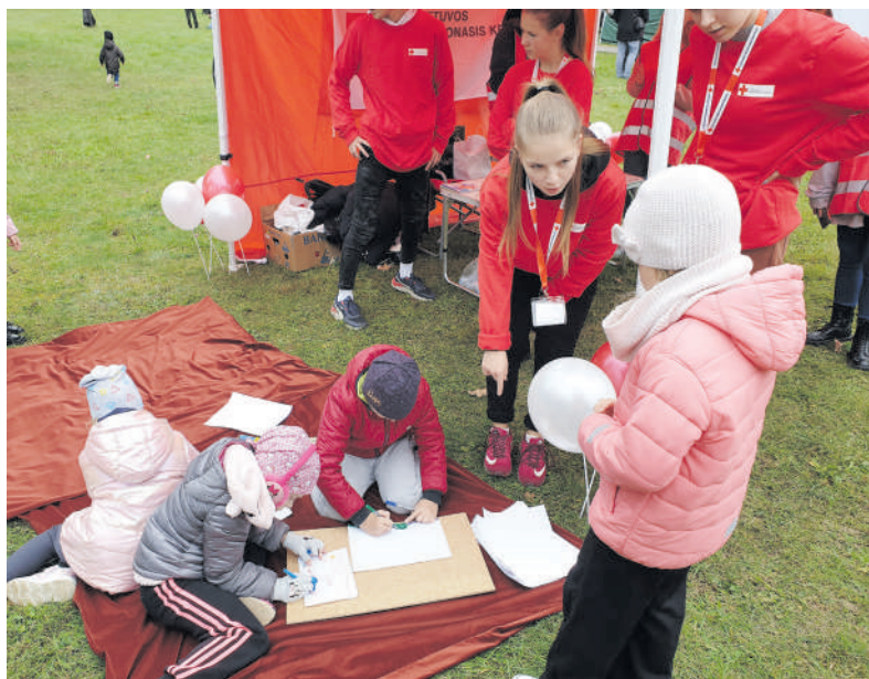
Veiklos mažiesiems Raudonojo kryžiaus savanorių palapinėje.