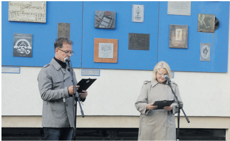
Atminimo ženklų atidengimo ceremonija.

Turbūt daugiausia dėmesio sulaukė daugelio tautų vėliavomis pasipuošęs L. Šepkos parkas. Visas šis vyksmas parke pavadintas „Pasaulio kaleidoskopu“. Mat čia buvo galima rasti palapines, kuriose buvo rodomos konkrečioms šalims būdingos veiklos. Prancūziją pristatė „Levandų vanagnė“, Graikiją – jungtinės Rokiškio jaunimo centro bei bibliotekos pajėgos su graikų deive priešakyje. Indijoje buvo galima pasidaryti laikiną tatuiruotę chna dažais, JAV palapinėje sėdėjo indėnės ir siūlė sapnų gaudyklėmis pagauti kuo spalvingesnius sapnus. Olandai siūlė parvežtus iš savo šalies originalius daiktus. Japonijoje mergina vaikus ir suaugusius mokino