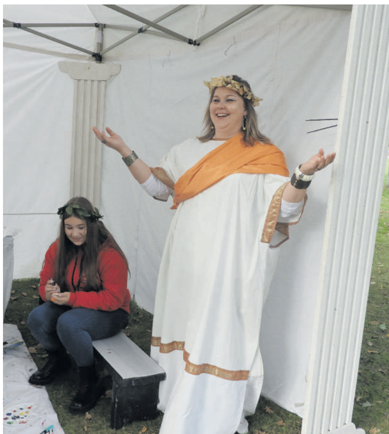
Deivė iš Graikijos.