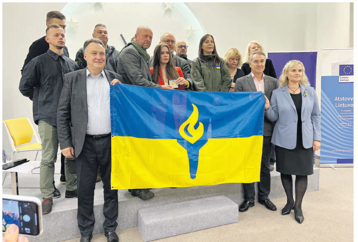
Po apdovanojimų ceremonijos.