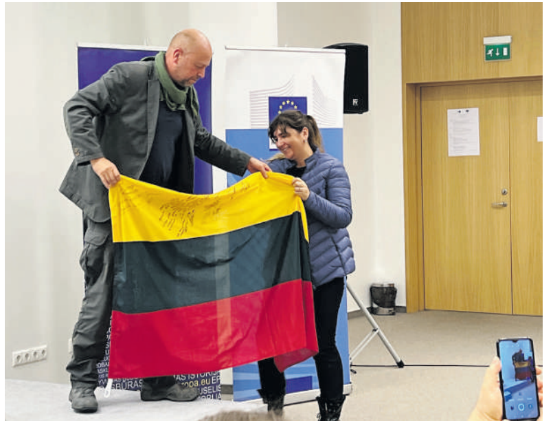
Ukrainietė įteikė Lietuvos vėliavą su ukrainiečių karių parašais.

Lietuvoje šį apdovanojimą jau yra pelnusi Šv. Jokūbo kelio savivaldybių asociacija, Lietuvos moterų lobistinė organizacija, Medardo Čoboto trečiojo amžiaus universitetas, Lietuvos negaliųjų forumas, restoranas „Jurgis ir Drakonas“ ir salotų baras „Mano guru“.