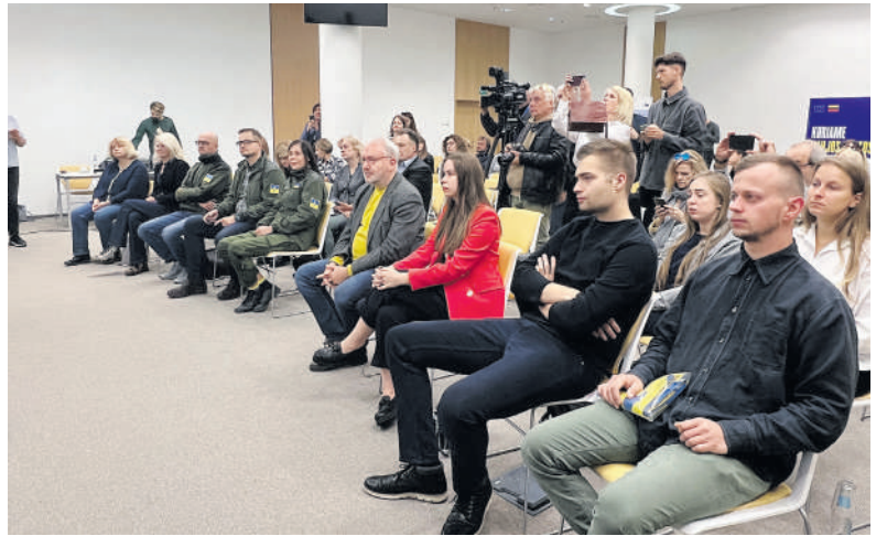
„Blue/Yellow“ komanda: menininkai, architektai, kino kūrėjai, režisieriai.