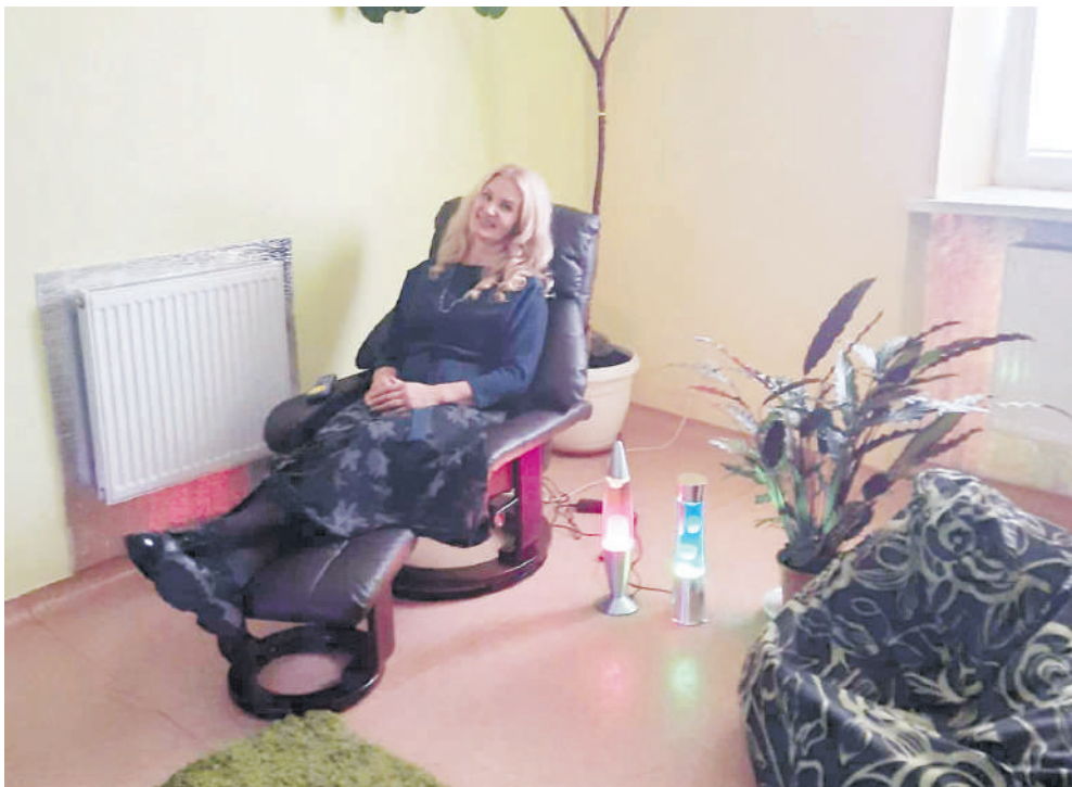
Ant relaksacinio krėslo.