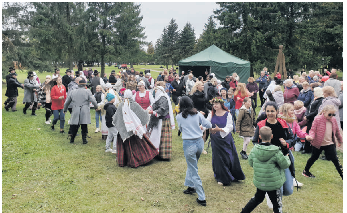
Rokiškėnai šoko kartu su visa Lietuva.