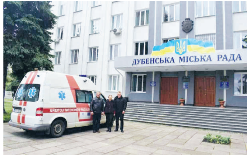
Dubno mero nuotraukoje – Rokiškio GMP automobilis prie jų savivaldybės.

Kaip rašoma Rokiškio rajono ligoninės interneto svetainėje, pasak