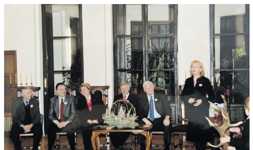
Pirmasis nepriklausomos Lietuvos prezidentas A. M. Brazauskas buvo dažnas svečias Rokiškio krašte.