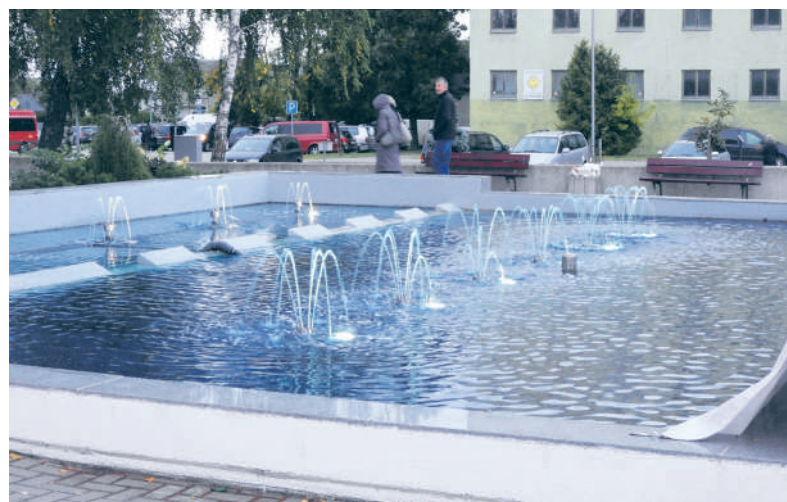
Atgijęs miesto fontanas.

Šiomet ta diena ypatinga, nes A. M. Brazauskui būtų sukakę 90 metų. Ta proga prieš išvykdamį į specialiai jam skirtą konferenciją, organizuojamą Lietuvos socialdemokratų partijos, Valdovų rūmuose, Vilniuje, Rokiškio socialdemokratams pagerbė jo atminimą. „Pirmajam po atkurtos Lietu-