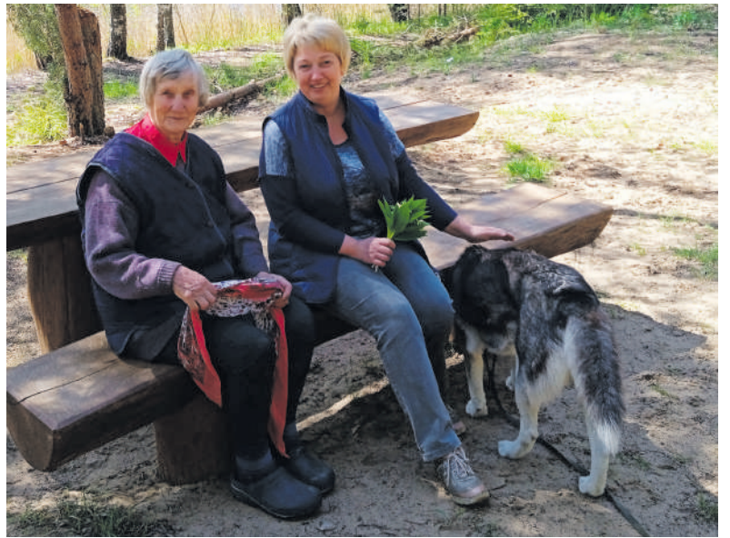
Su mama.

„Galime mokytis įvairių dalykų. Nesu gavusi neigiamo atsakymo, kad neleis ar neapmokės. Renkamės ir tariamės laisva valia bei gauname vadovų pritarimą. Kiekvienas savo gyvenime ir darbe dėlioja plusus ir minusus. Man visada plusai