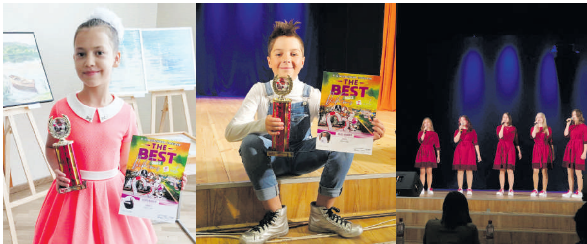
Rokiškio R. Lymano muzikos mokyklos auklėtiniai skynė laurus konkurse.

2022 metų rugsėjo 17-18 dienomis Daugpilyje (Latvijoje) vyko III tarptautinis konkursas „The Best“.