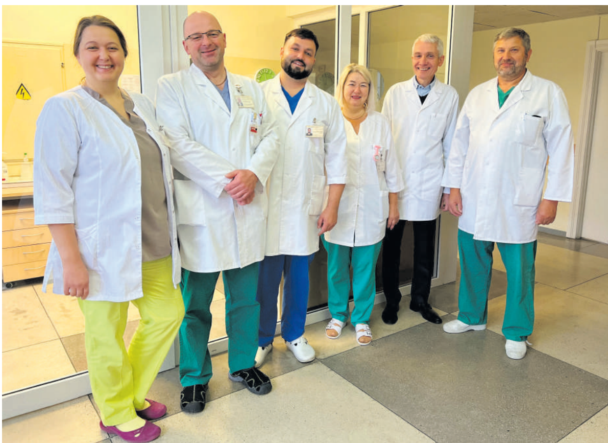
Rokiškio rajono ligoninės Chirurgijos profilio gydytojų kolektyvas.