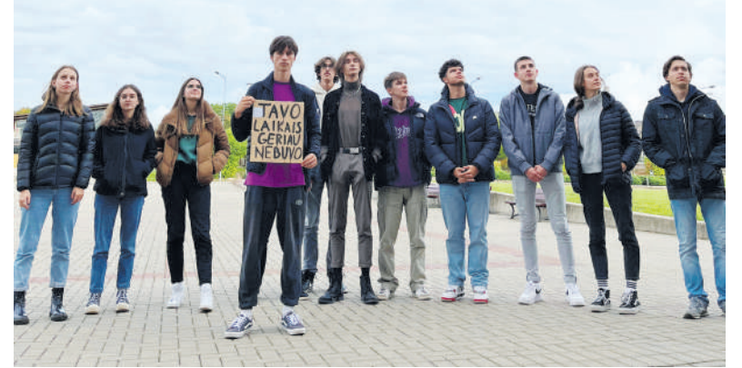
Rokiškio jaunimas aktyviai formuoja bendraamžių nuomonę.

Rugsėjo 19-25 dienomis Lietuvos jaunimo organizacijų taryba (LiJOT) švenčia savo 30-ąjį gimtadienį. Šia proga nuo rugsėjo 20 iki 22 dienos trisdešimtyje Lietuvos savivaldybių organizuojamos akcijos, skatinančios atkreipti visuomenės dėmesį į jaunimą bei viešinančios LiJOT bei jaunimo politikos vardą. Tai būdas atskleisti LiJOT kaip organizaciją, kryptingai siekiančią tikslų ir drąsiai neatitikti visuomenei įprasto organizacijos identiteto.