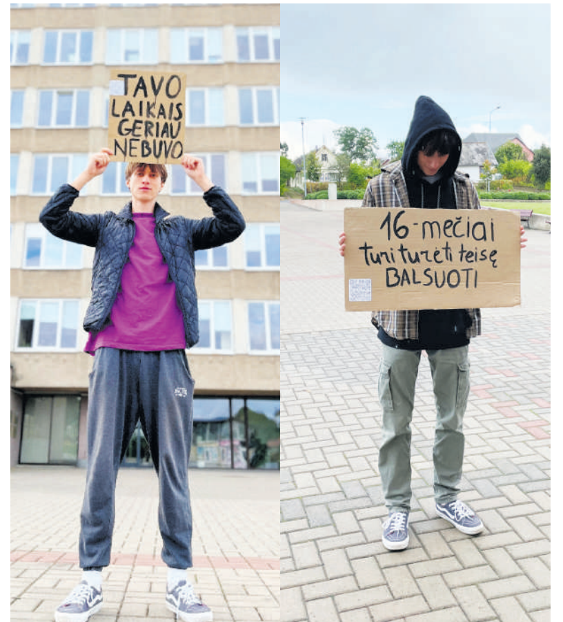
Akcijos akimirkos.

Jauni žmonės tokiomis akcijomis siekia, kad jų transliuojama žinutė kuo plačiau pasklistų po Lietuvos miestus ir miestelius, o jaunimas galėtų drąsiau reikšti savo nuomonę.