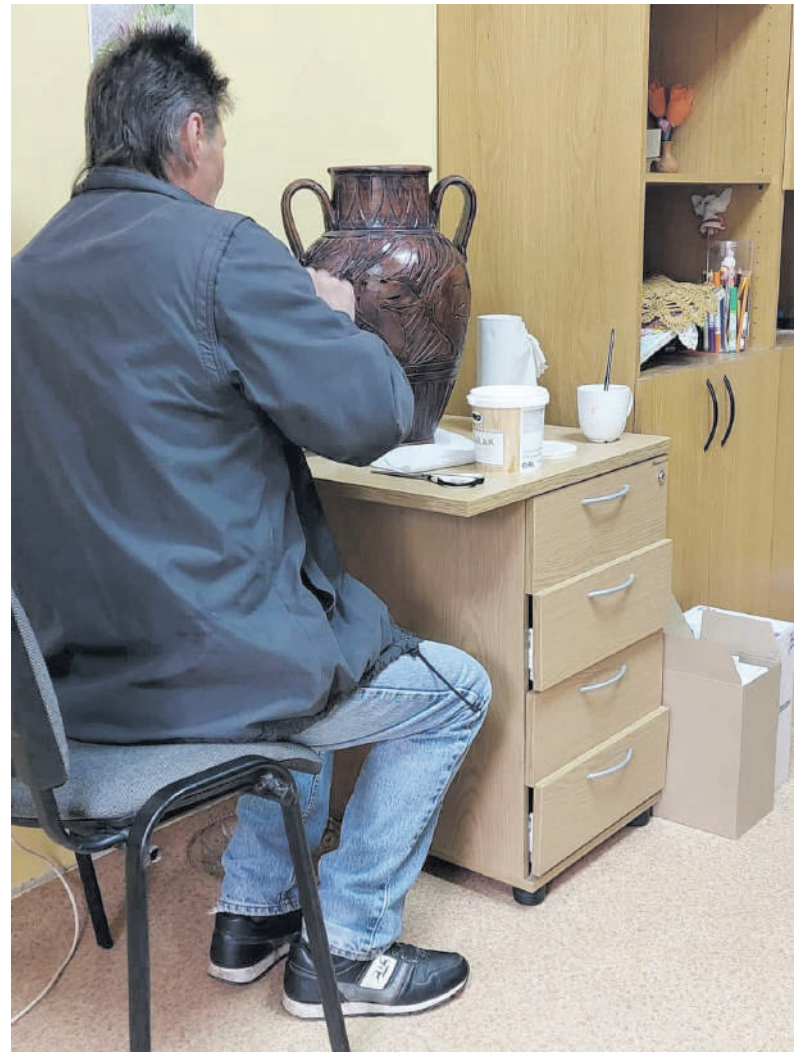
Obelių savarankiško gyvenimo namų gyventojai skiria laiko kūrybai.

„Kaip bebuvę, šie žmonės turi širdis ir jausmus. Nėra taip, kad turinčiam priklausomybę žmogui niekas nerūpi. Būna aštresnių etapų, kai žmonės gauna išmokas – tuomet suvaldyti juos sunkiau, bet kai pasibaigia pinigai, kiekvienas nori kažkuo užsiimti, būti svarbus ir reikalingas. Su jais dirba psichologai, priklausomybių ligų konsultantai. Jeigu pamatai, kad gyventojas turi gabumų, stengiesi jį skatinti. Kartą žmogus, kuris turėjo rimtą negalią (buvo netekęs galūnių) pagal neįgalųjų reabilitacijos programą mokėsi Kaune, darė labai gražius darbelius, važiuodavo į parodas. Vidinį skausmą jis užpildydavo kūryba. Šiandien jo nebėra, išėjo į Amžinybę“, – sako direktorė.