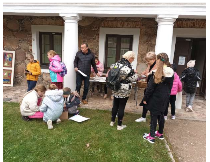
Ekspedicija Rokiškio krašto muziejuje.

Europos paveldo dienas neatsitiktinai baigėme ekspedicija po dvaro parką – Rokiškio dvaro parkas švenčia 225 metų sukaktį.