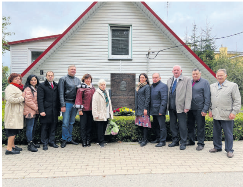
Kasmet rugsėjo 22 dieną Rokiškio socialdemokratai prie namo Laisvės gatvėje, Rokiškyje, prisimena Prezidentą A. M. Brazauską.