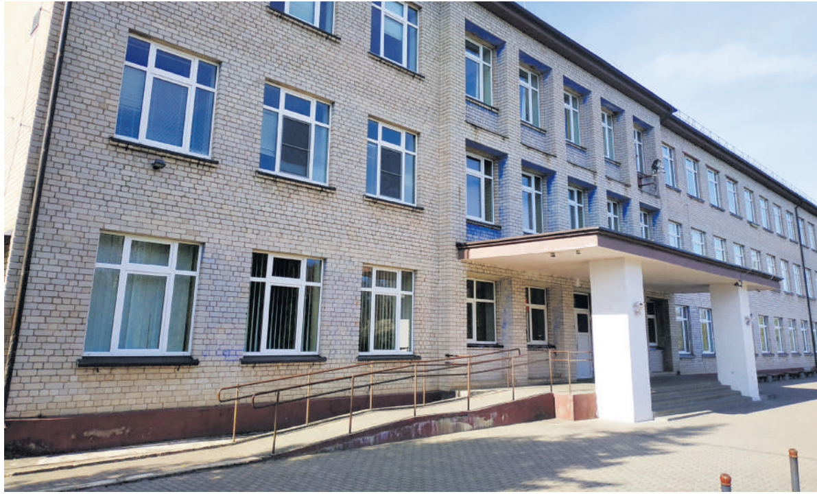
Buvęs Panemunėlio mokyklos pastatas.