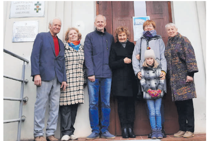
Svečių apsilankymas Laisvės kovų istorijos muziejuje Obeliuose.