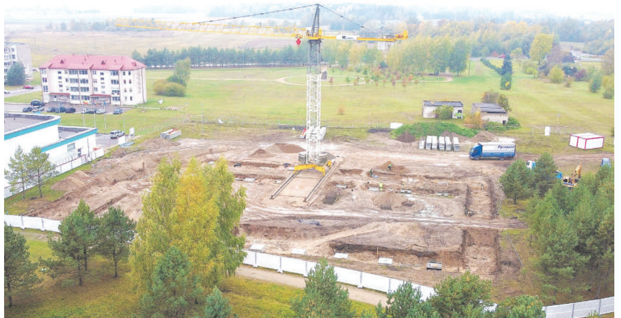
Statoma Rokiškio sporto arena.

Naujoji 2 745 kv. m. sporto arena, kurioje galės treniruotis įvairaus amžiaus ir įvairių sporto šakų atstovai, priklausys Rokiškio sporto centrui. Čia vyks ir oficialios varžybos, taip pat naujomis erdvėmis galės naudotis ir gyventojai.