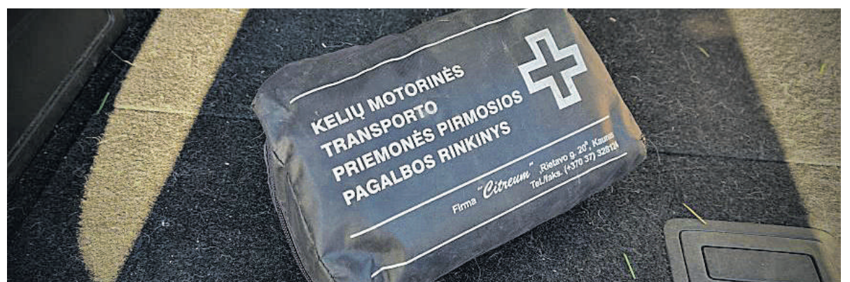
Automobilio vaistinė.

Pirmosios pagalbos rinkiniuose esančios medicinos priemonės turi būti paženklintos privalomu atitikties ženklu CE, kuris patvirtina, kad šios medicinos priemonės gamintojas laikosi nustatytų saugos reikalavimų, atliko visas būtinas atitikties vertinimo procedūras ir užtikrina, kad jo pagaminta medicinos priemonė yra saugi, naudojant ją pagal paskirtį ir laikantis naudojimo instrukcijos. Asmenys, prieš pirkdami medicinos priemones iš ne Europos Sąjungos gamintojų turi pasidomėti, ar medicinos priemonė tinkamai paženklinta, ar gamin-