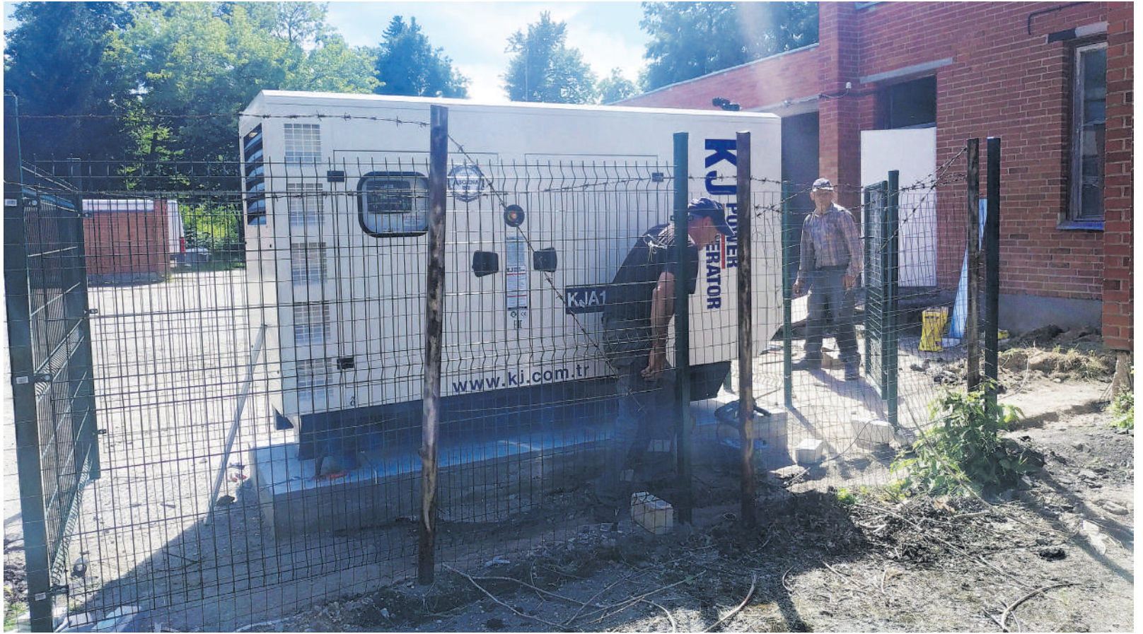
Naujasis Rokiškio rajono ligoninės generatorius užtikrino, kad gydymo įstaigai nenutrūktų elektros tiekimas.

Užtat naktį siautęs vėjas ir stiprus lietus prikrėtė eibių Rokiškio rajono ligoninei, nes dalyje skyriuje trumpam dingo elektra. Laimei, šiuo atveju situaciją išgelbėjo šių metų vasarą įstaigos įsigytas elektros generatorius, kuris, vos prapuolus elektrai, įsi-