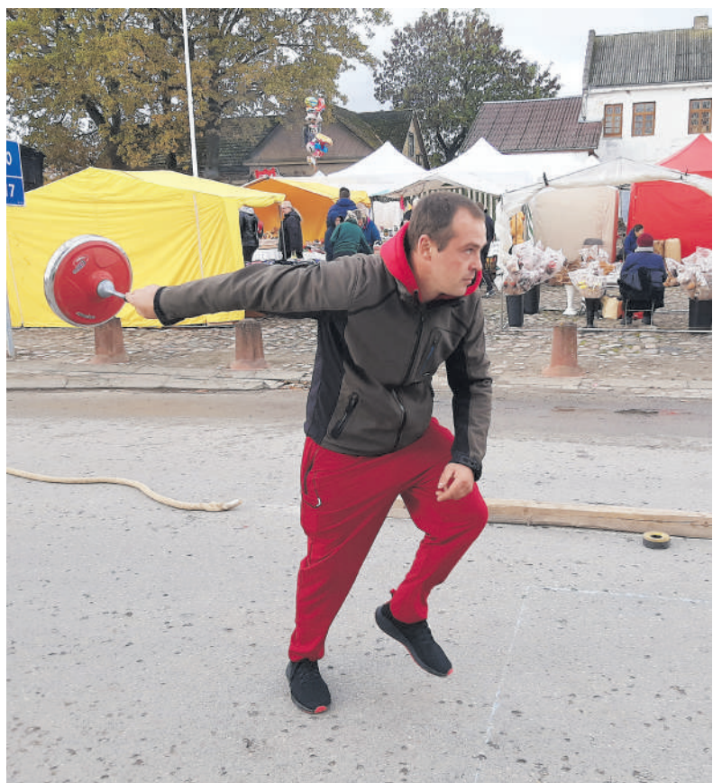
Norintieji galėjo išbandyti dar neįprastą sporto šaką Lietuvoje bavišką akmenslydį.