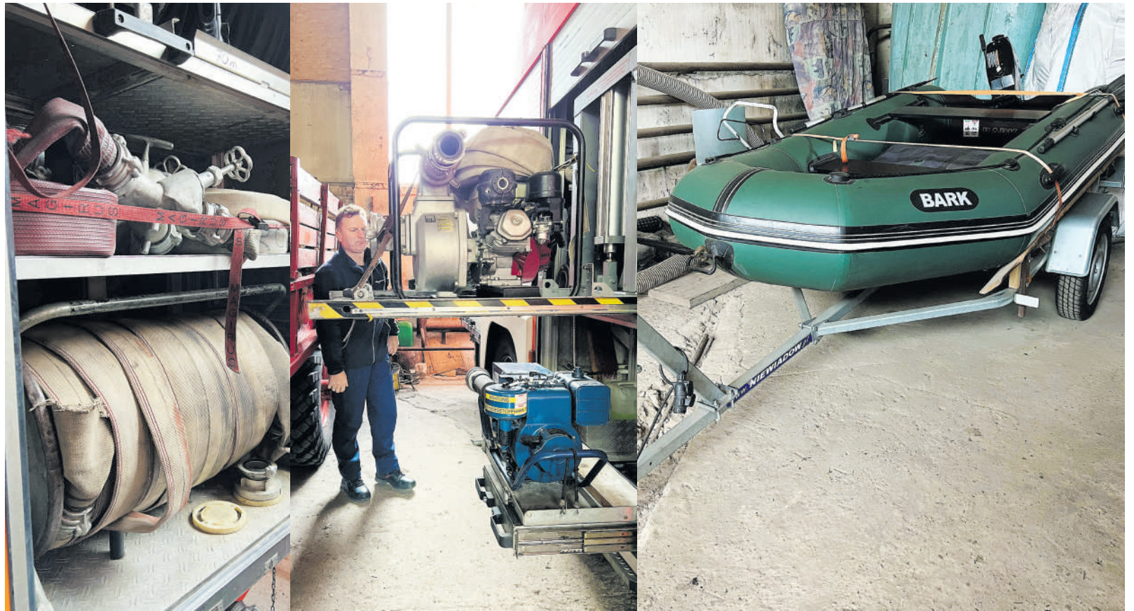
Laibgaliuose esanti ugniagesių savanorių komanda, kaip ir likusios 8 rajone, aprūpinta visa būtinausia įranga ir technika.

Tiesa, kalbantys paaiškėjo, kodėl tokie paklausūs šios tarnybos ugniagesiai, valantys kaminus, kad jų pagalbos šaukiasi ir kaimyninių rajonų gyventojai,