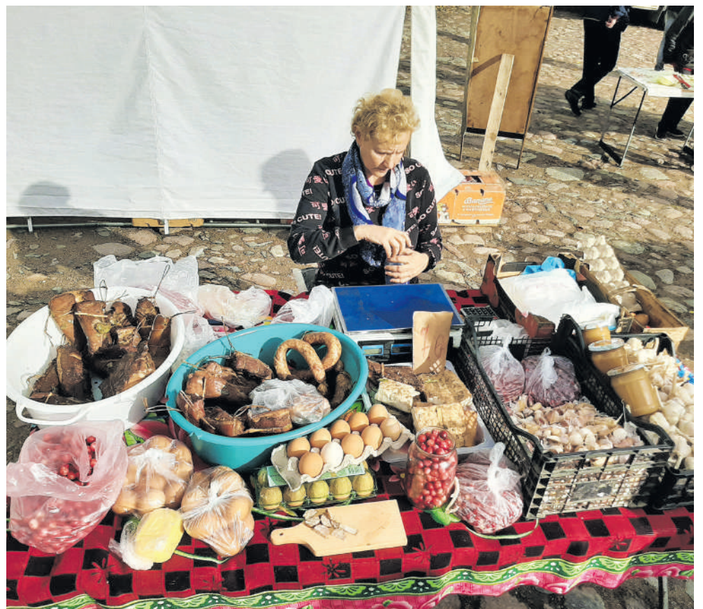
Mugėje netrūko naminių natūralių produktų.