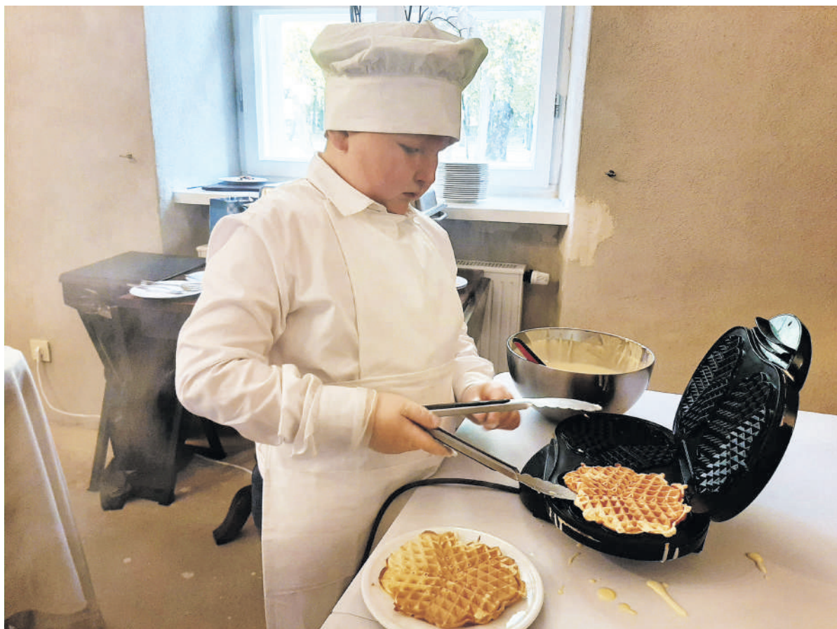
Septynmetis salietis seka mamos pėdomis, bet neišsižada ir sportininko karjeros.