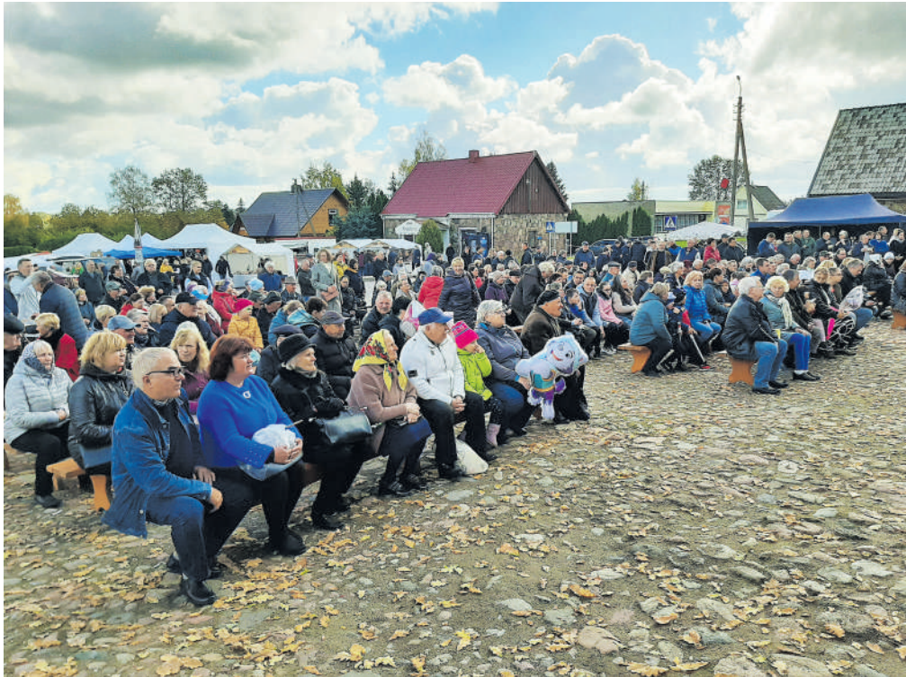
Šventė sutraukė didelį būrį kamajiškių ir svečių.