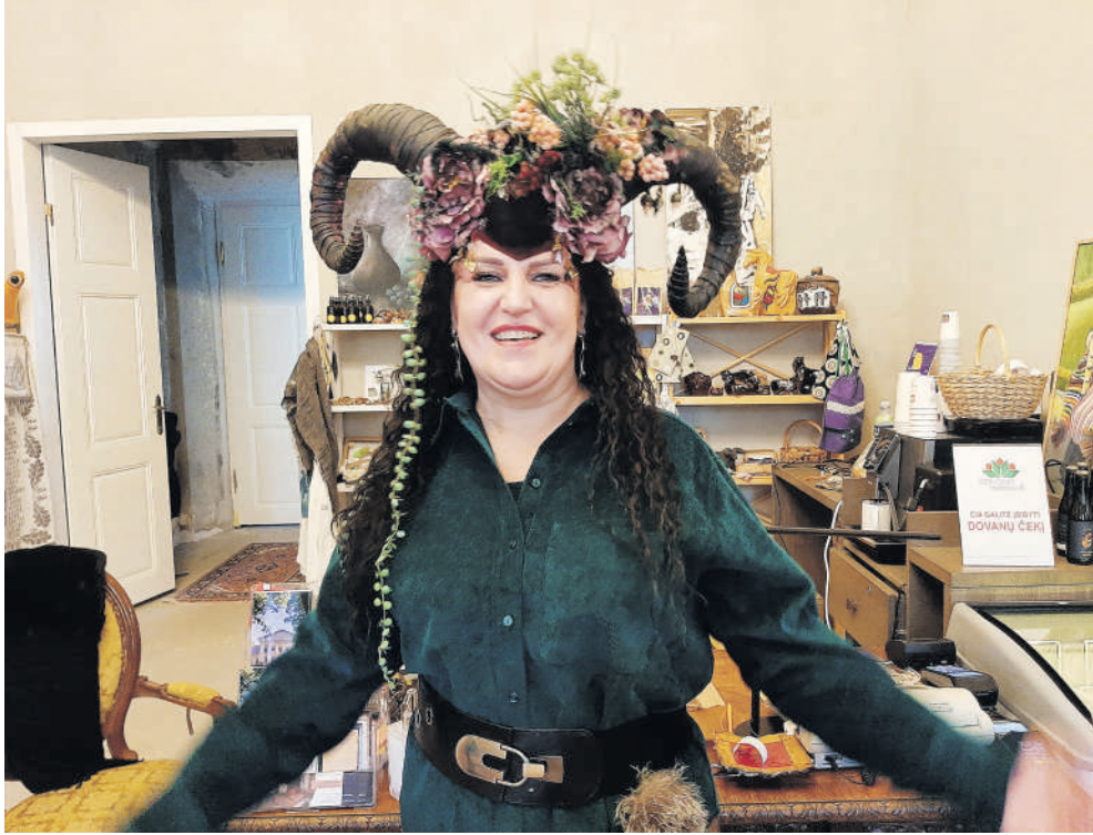
Šventė prasidėjo Salų dvare.