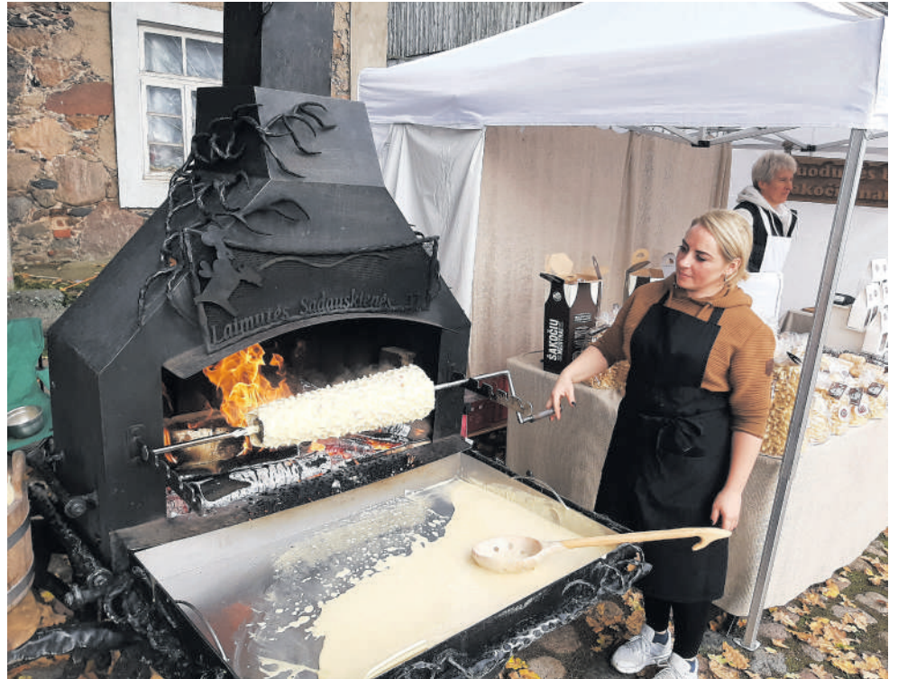
Juodupiečiai kepė šakočius.