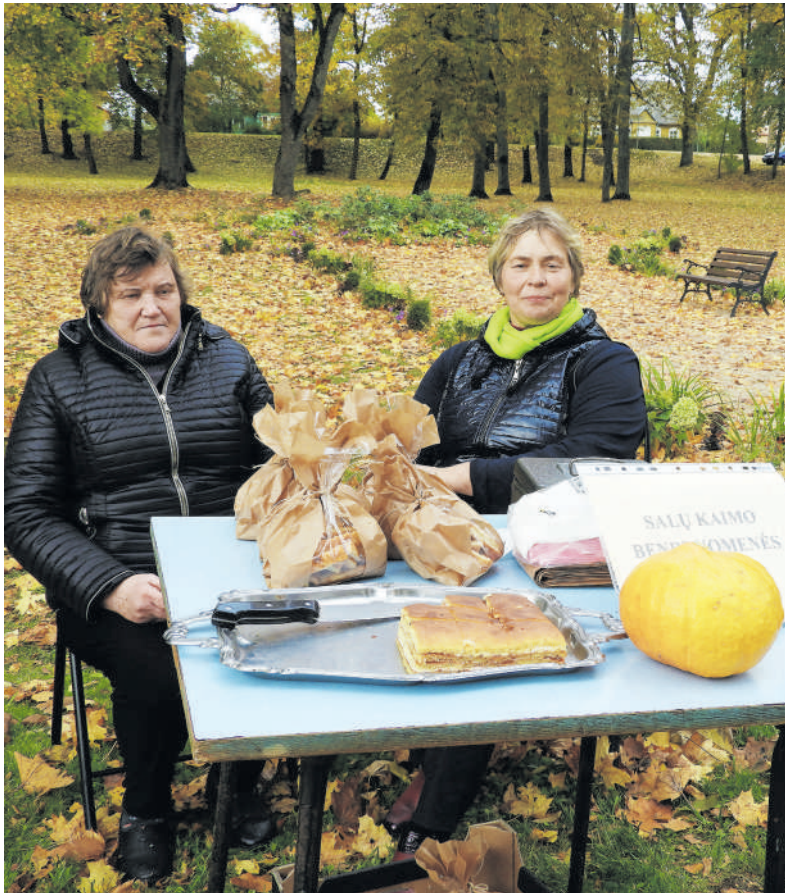
Salų kaimo bendruomenė priėmė saldumynų.