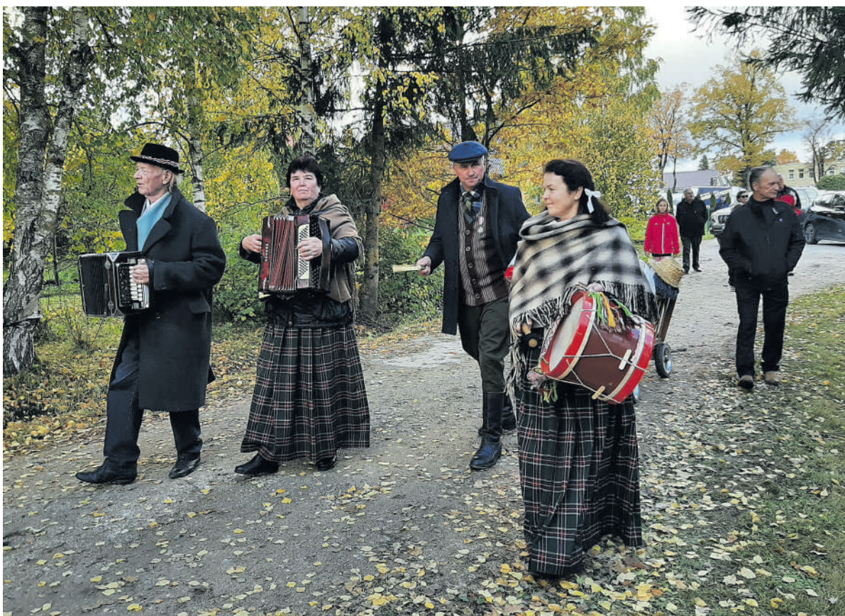
Susirinkusius į Kamajus linksmino muzikantai.