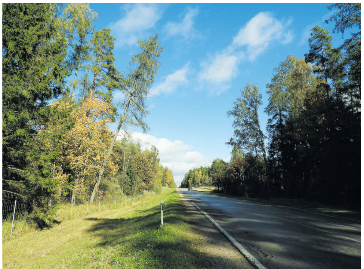
Pasviręs pakelės medis baugina vairuotojus.