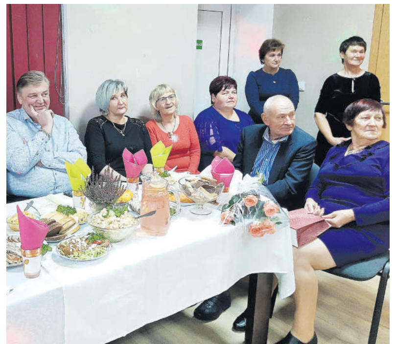
Tradicinis bendruomenės vakaras.