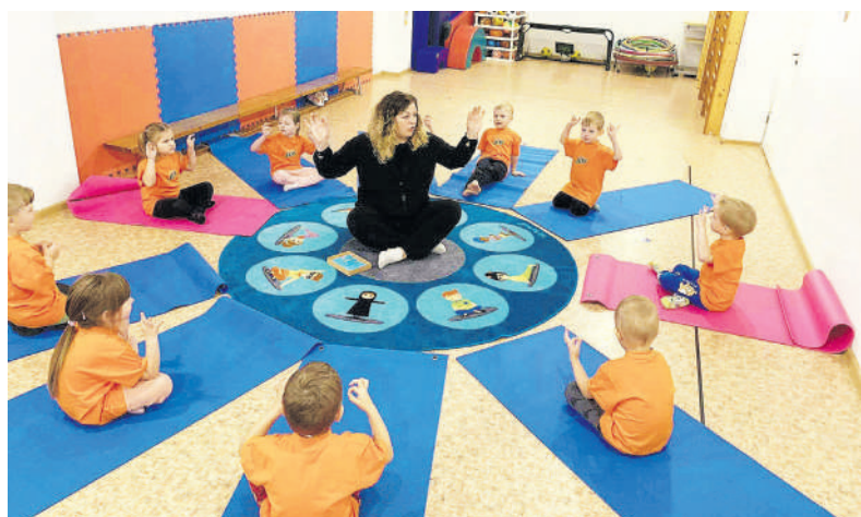
Projekto įgyvendinimo laikotarpiu vyko įdomūs renginiai.

Emocijos ir aš. Rugsėjo mėnesį visuomenės sveikatos specialistė vykdė streso ir sunkių emocijų valdymo praktinius užsiėmimus grupėse. Panaudojant „Mindful“ labirintų lenteles vaikai mokėsi valdyti emocijas ir lavino dėmesingumą atliekant kvėpavimo pratimus. Edukacinės veiklos „Piktuko nuotykių“ metu žiūrėjome filmukus „Mano emocijos“. Atliko praktines užduoteles, kaip reikia valdyti pyktį ir baimę, keliavome „šypsenėlių keliu“.