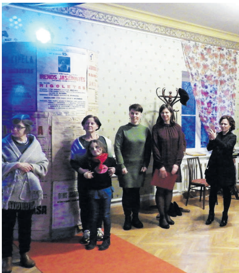
Parodoje dalintasi prisiminimais apie operos solistę. („Rokiškio Sirenos“ nuotr.)