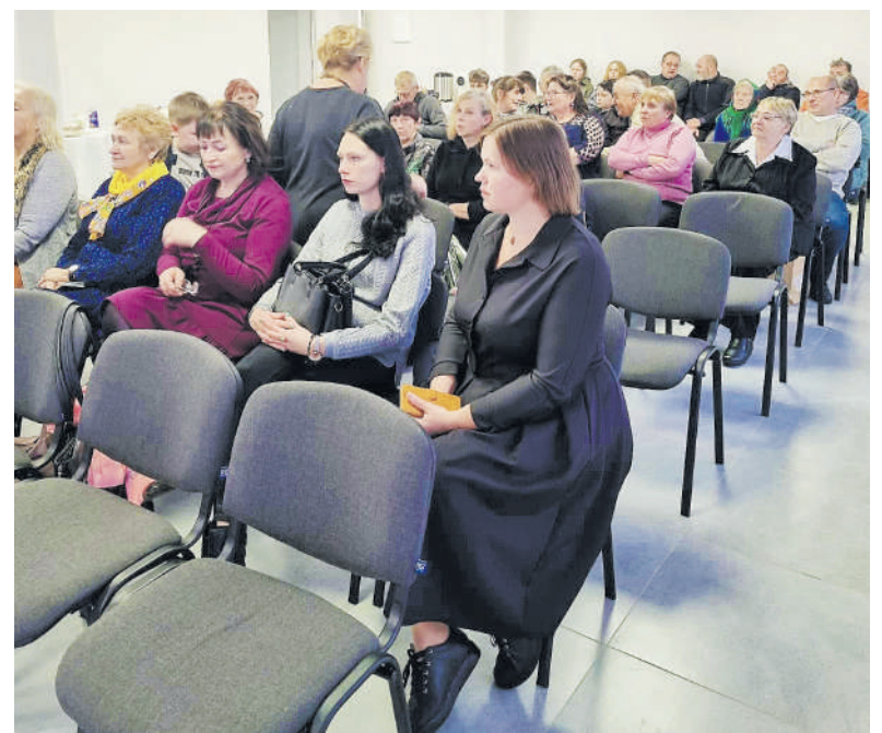
Baigiantis rudenii Kairelių bendruomenė renka aptarti nuveiktus darbus.