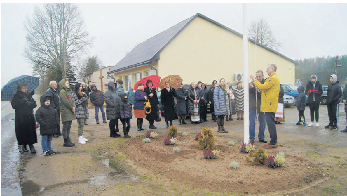
Prastas oras nesugadino šventės.