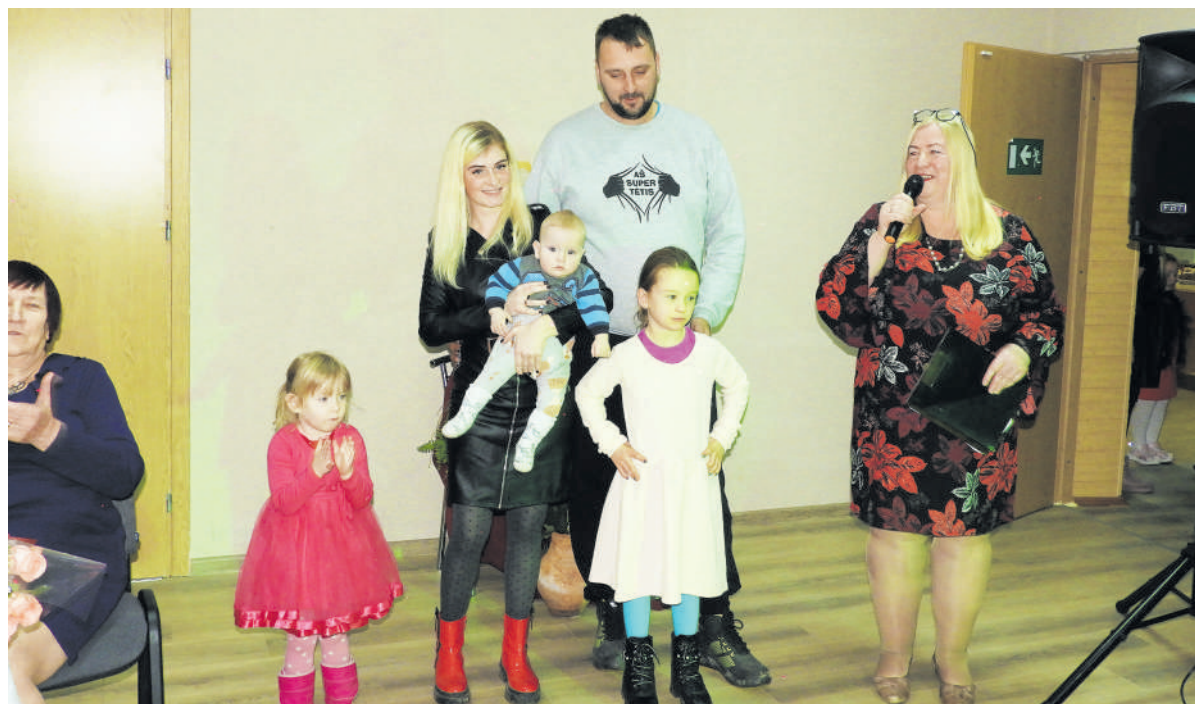
Nauji Pakriaunių bendruomenės nariai – Skavičių šeimyna.