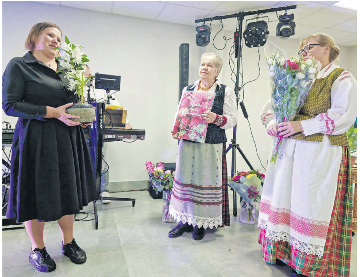
Renginio metu padėkota darbščiausiems Kairelių bendruomenės nariams.

Renginyje netrūko padėkų ir sveikinimo žodžių ne tik jubiliejines