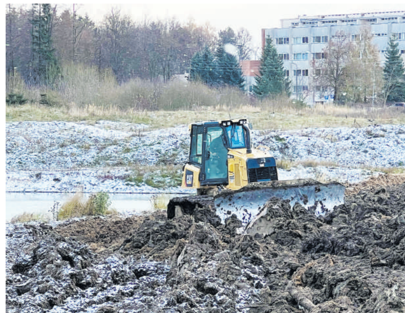
Aplink tvenkinį pradėta lyginti teritorija.