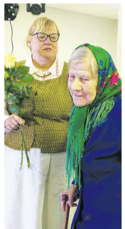
Pagerbti vyriausi bendruomenės nariai.