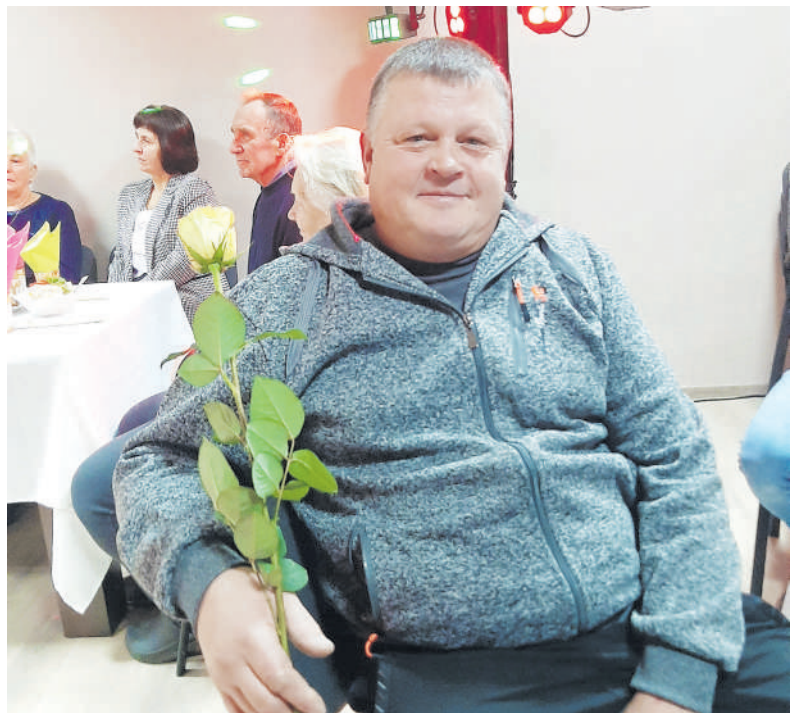
Padėkota J. Nikitiniui.