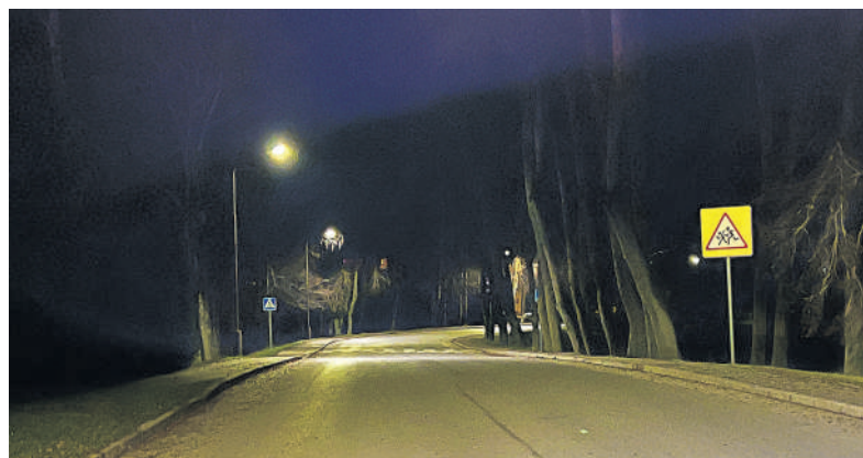
Kavoliškyje naujais LED šviestuvais apšviesta Melioratorių gatvė.