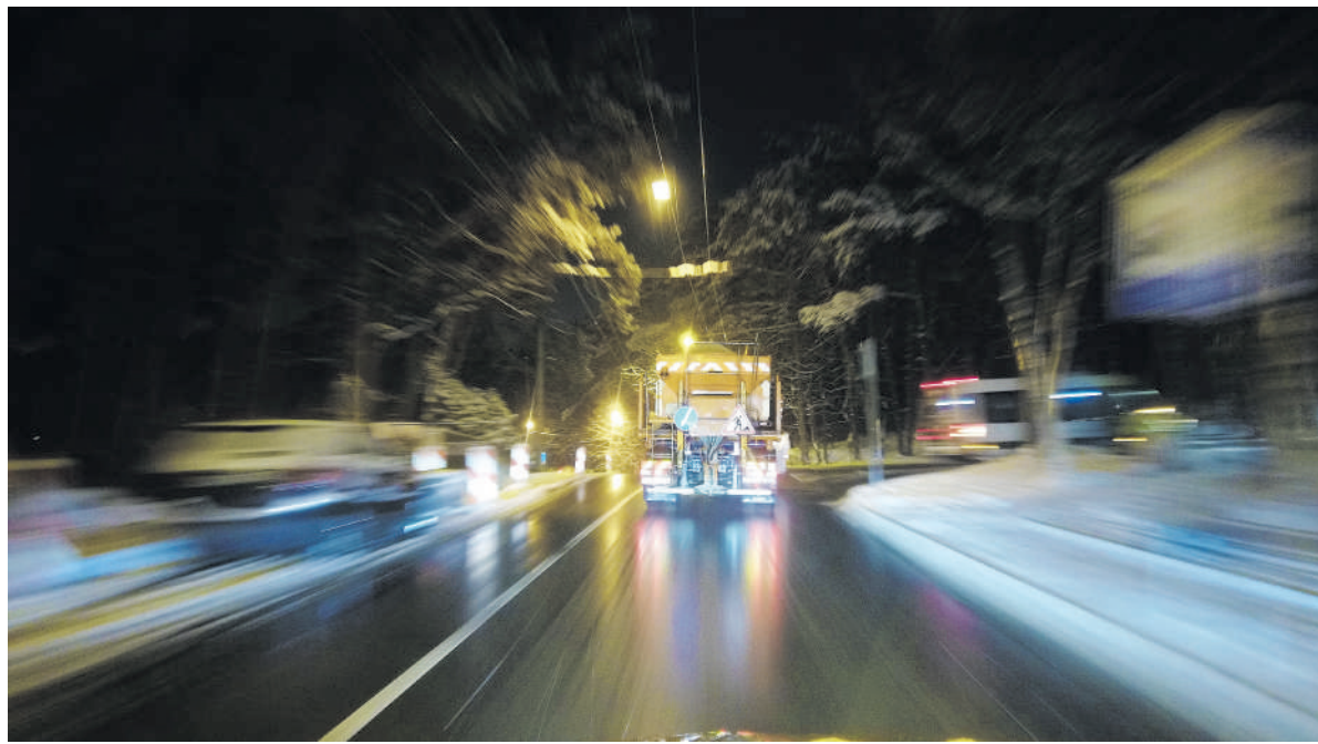
Kelininkai darbuojasi nuo 4 valandos ryto.

vo, nuo lapkričio 1 d. įsigaliojo reikalavimas, kad trečio priežiūros lygio keliai būtų barstomi tik druska, anksčiau galima buvo naudoti smėlio ir druskos mišinį.