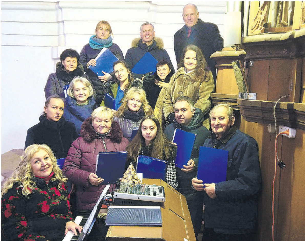
Lapkričio 20-ąją per Kristaus Karaliaus iškilmes Rokiškio kultūros centro rajono padalinio Jūžintuose sakralinės muzikos kolektyvas giedojo skambant naujiems elektriniams vargonams.

„Vargonų meistras konstatavo, kad labai prastos būklės senieji vargonai tikrai nebetinka naudojimui. Matyt, kunigo Jono galvoje sukosi mintis, jog mūsų choras labai stiprus, o mano turėti elektriniai vargonėliai, kuriuos