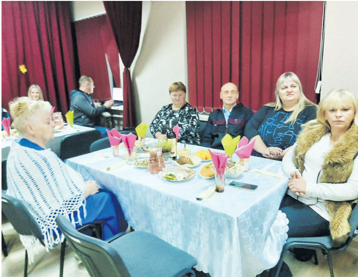
Pakriaunių kaimo bendruomenė „Pakriauna“ susirinko padėkoti už nuveiktus darbus.

Vakaronės metu pagerbti bendruomenei talkinę žmonės. Už „Metų darbą“ įvertinti prie vaikų dienos centro veiklos prisidėję žmonės. Atnaujinant pastato