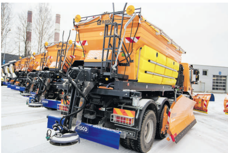
Kelių barstymui ir valymui parengta technika.

Seni atokiau gyvenantys žmonės nelieka atkirsti, reaguojame, padedame. Dirbame ir savaitgaliais, kai reikia, ir naktį išvažiuojame, nėra taip, kad miegam ir niekas niekam nerūpi“, – sako pašnekovė.