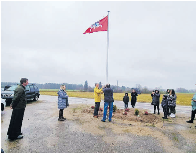
Kaip tautiškumo puoselėjimo simbolis iškelta vėliava su Vyčiu.