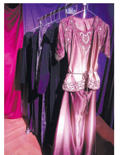
Primadonos asmeniniai daiktai.