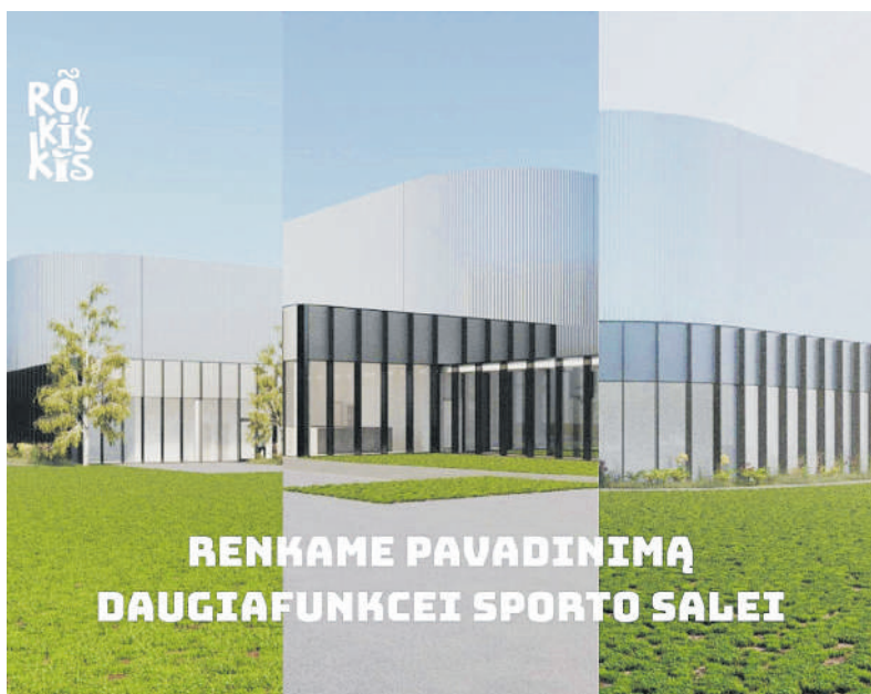
Rokiškėnai gali siūlyti vardus statomam sporto centrui.