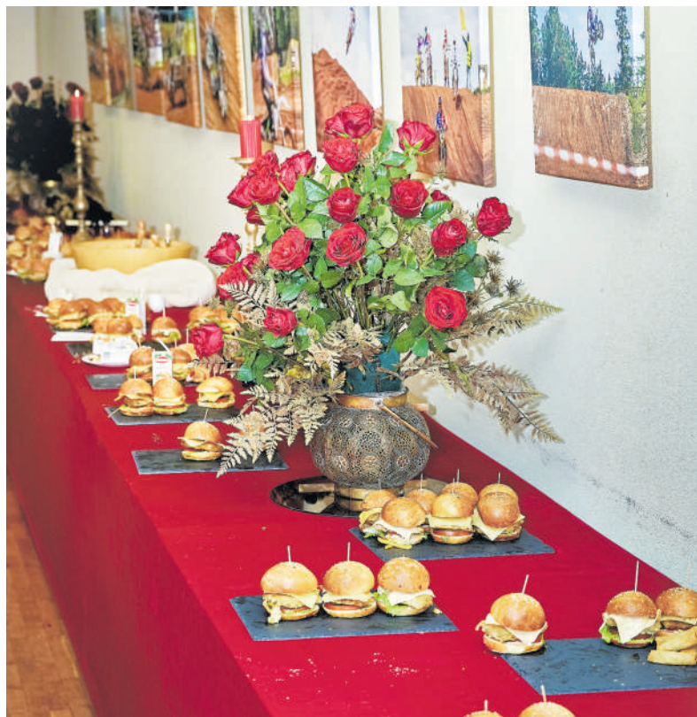
Vaišės mažiesiems.