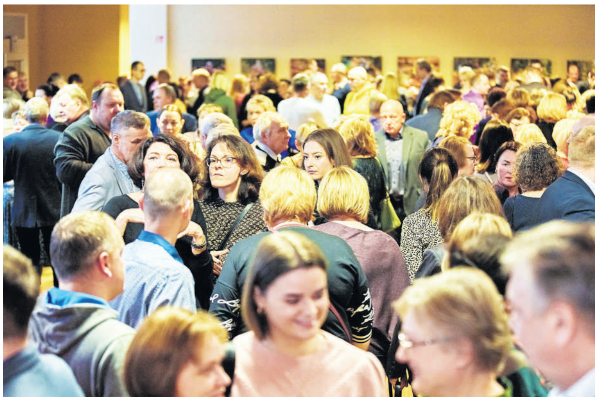
Į šventinius renginius suvažiuoja AB „Rokiškio sūris“ darbuotojai iš visos Lietuvos.