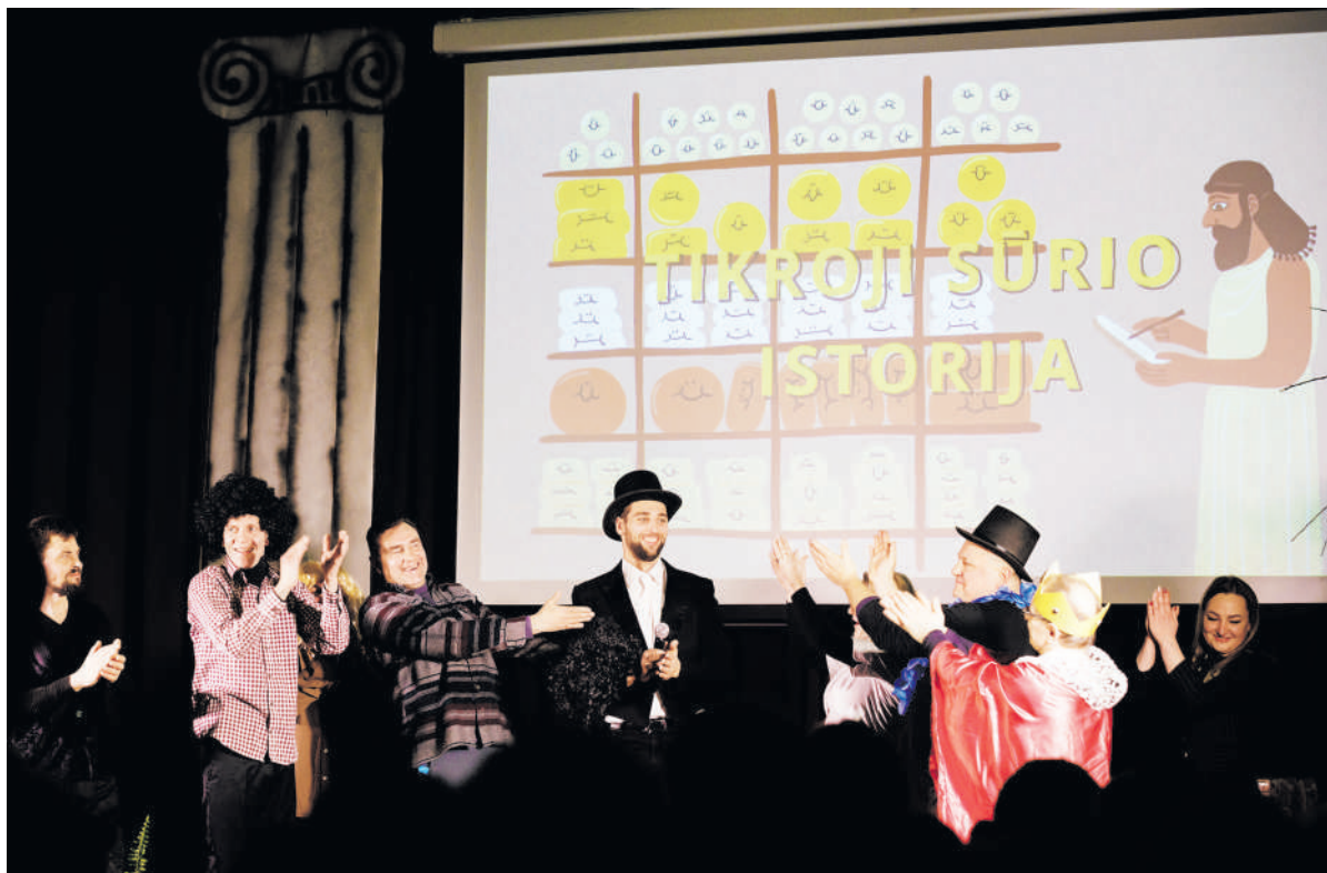
2022 metus gamyklos darbuotojai baigė pačių pastatytu nuotaikingu spektakliu.

Į šventinius renginius suvažiuoja darbuotojai iš visos Lietuvos, nes AB „Rokiškio sūris“ dirba apie 1 300 žmonių trijose gamyklose Rokiškyje, Ukmergėje ir Utenoje bei pieno surinkimo punktuose, veikiančiuose įvairiose šalies vietovėse.