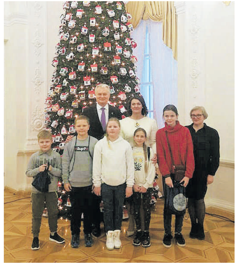
Moksleivius iš Rokiškio rajono priėmė Prezidentas G. Nausėda ir Pirmoji Ponia D. Nausėdienė.