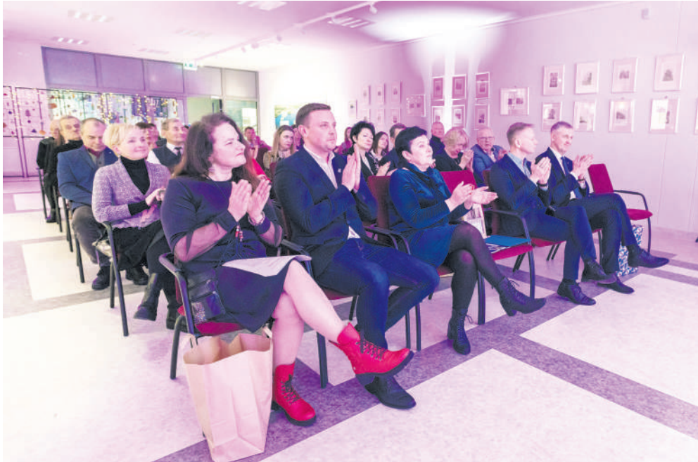
Baigiantis metams surengtas lankstinuko „Mūsų Jūžintai Jūsų“ pristatymas.