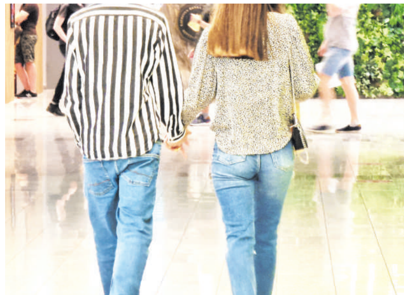
Gimstamumas rajone kasmet mažėja.