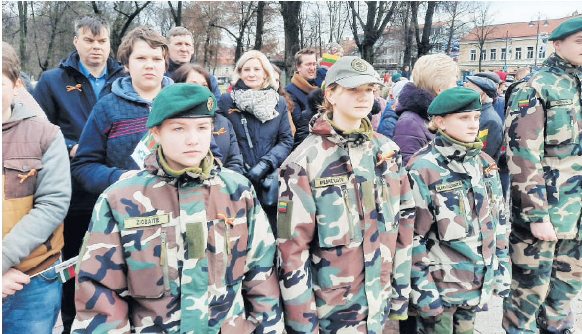
Pandėliečiai dalyvavo vėliavos perdavimo ceremonijoje Vilniuje.

Apie dalyvavimą šioje iškilmingoje Trispalvės perdavimo ceremonijoje Laisvės kovų istorijos muziejaus Obeliuose muziejinin-