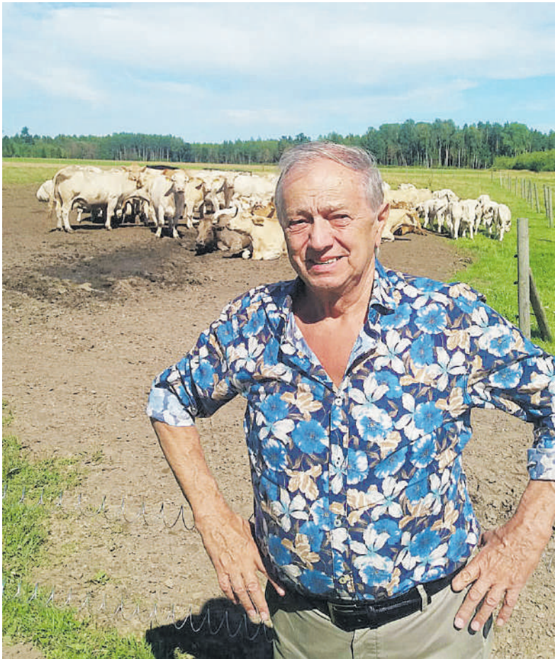
A. Frosio tvirtina, kad yra sukūręs būdą, kaip suteikti atmintį bakterinėms pieno ląstelėms.

Mūsų visuomenė dabar gerai supranta, kad tinkama mityba pagerina savijautą ir gyvenimo