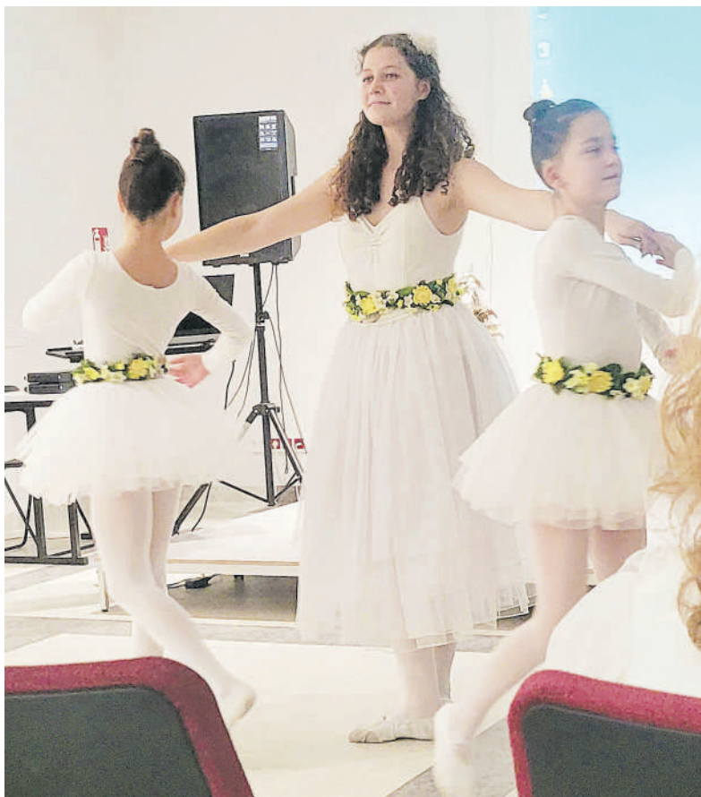
Jaunųjų šokėjų pasirodymas.