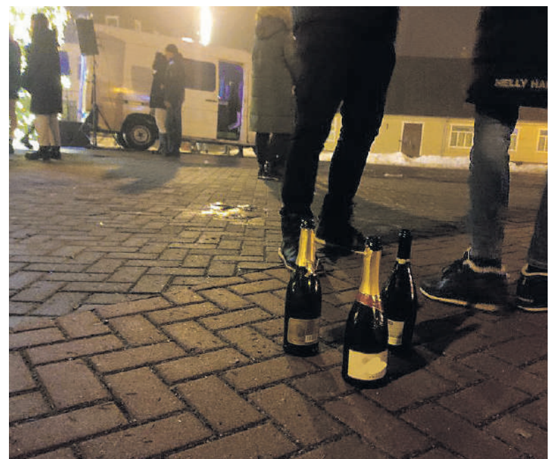
Naujųjų metų naktį alkoholis pridarė bėdų kai kuriems rokiškėnams.