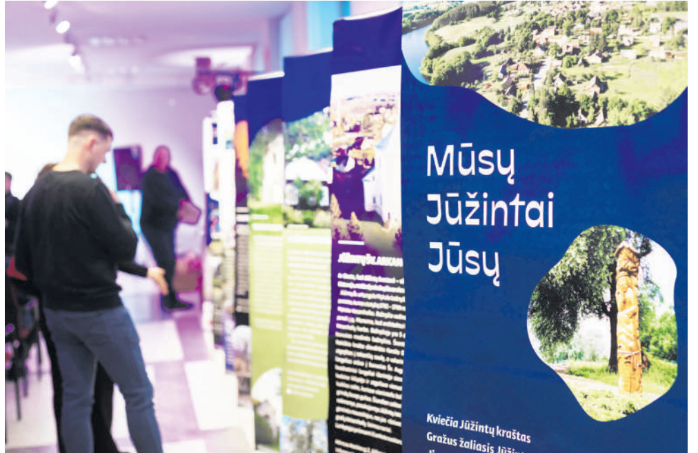
Jūžintų kraštas turtingas kultūrinu ir istoriniu paveldu.