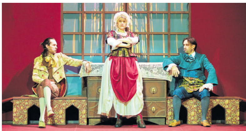
Šventinis spektaklis dovanų – darbuotojų vaikams ir anūkams.