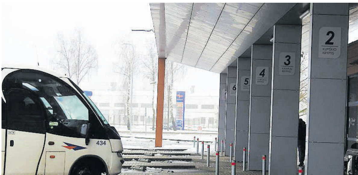
Slidus kelias pridarė bėdų keleiviniam transportui.