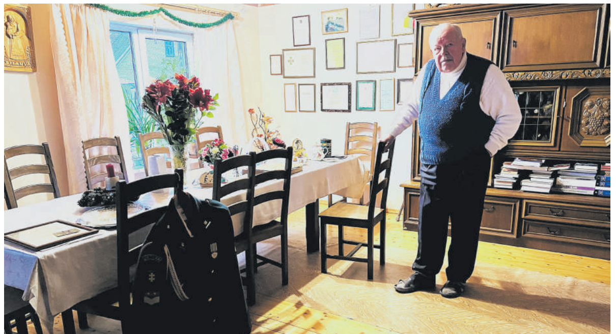
Šiame kambaryje kažkada buvo mokyklos klasė.