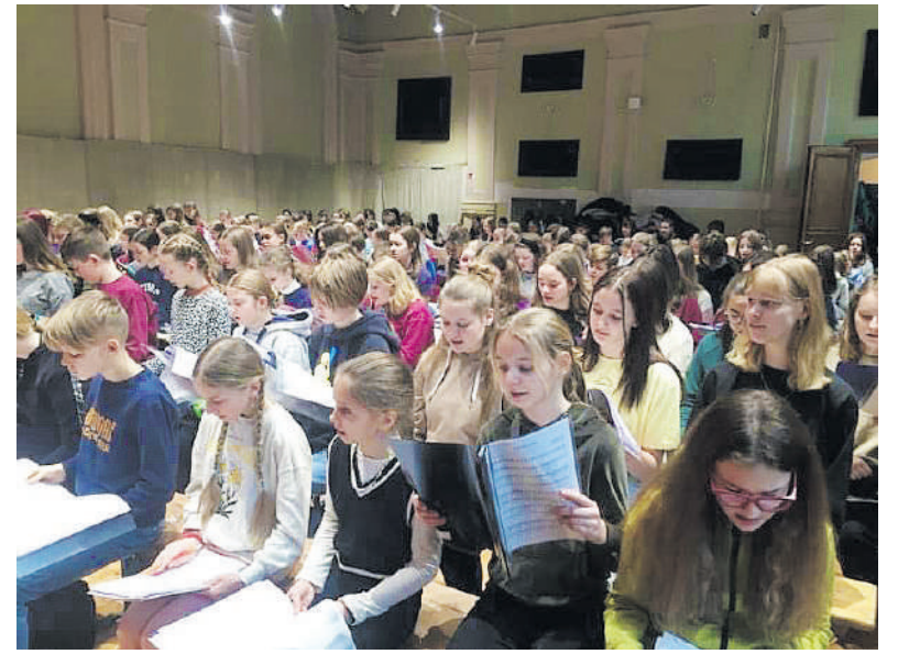
Kamajiškiai dalyvauja projekte „Jungtinis Lietuvos vaikų choras“.

Vasario pradžioje Kamaju Antano Strazdo gimnazijos neformaliojo švietimo skyriaus dainorėlių grupė vyko į pirmąją jungtinę repeticiją Vilniuje, Nacionaliniame kultūros centre. Kamajiškiai įsijungė į projektą „Jungtinis Lietuvos vaikų choras“.