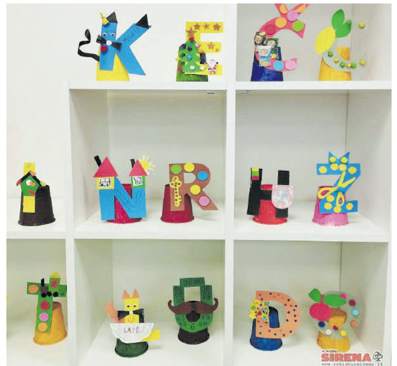
Žaismingos vaikiško raidelės.