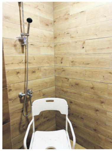
Higienos centras patogiai pritaikytas poreikiams.

Kelionė pirmyn ir atgal į šias higienos patalpas pagalbos į namus paslaugas gaunantiems žmonėms nieko nekainuoja, nes automobilį skiria seniūnijos administracija, taip pat nė cento nereikia mokėti už