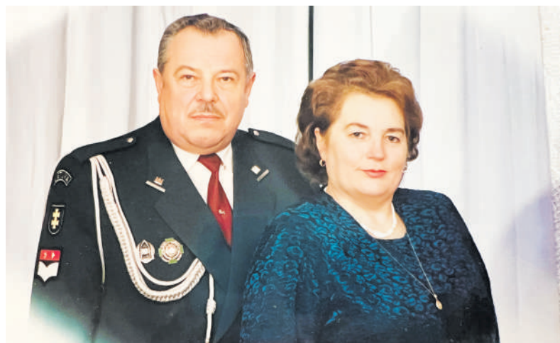
Pora įsitikinusi, kad tvirtos santuokos pagrindas – pasitikėjimas ir kalbėjimasis.