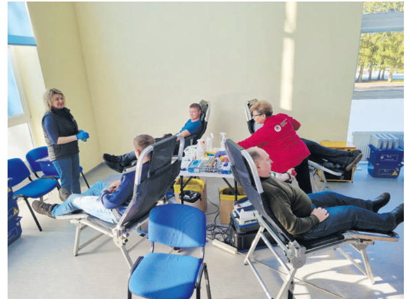
Dovanoti kraujo ryto valandomis aktyviau rinkosi vyriška kompanija.