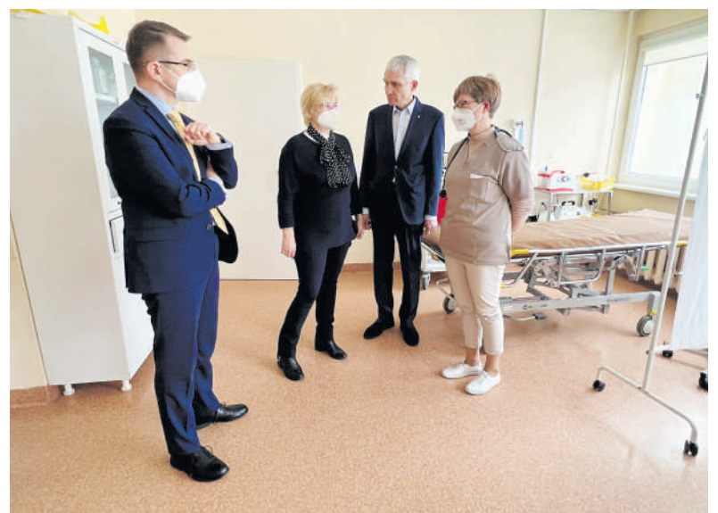
Rokiškio rajono ligoninės priėmimo skyriuje.

Ministras A. Dulkys šiemet gydymo įstaigas aplankė jau šešiuose rajonuose: Kaišiadorių, Kėdainių, Pakruojo, Tauragės, Vilkaviškio ir Rokiškio.