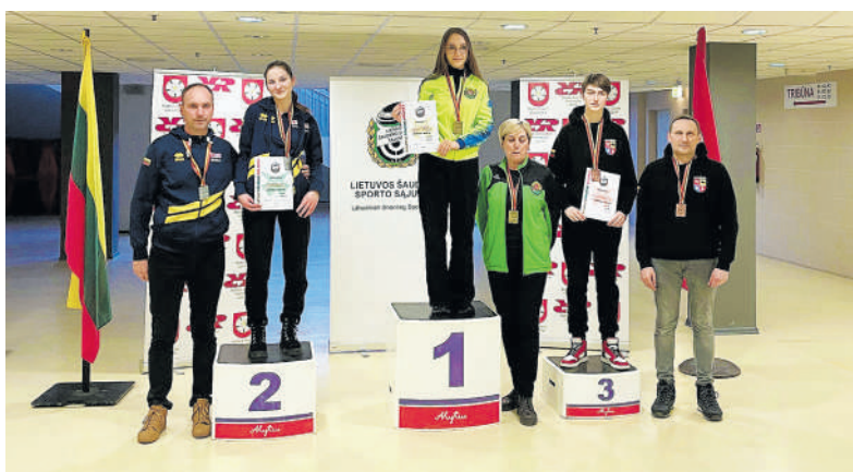
Ant nugalėtojų pakylas.