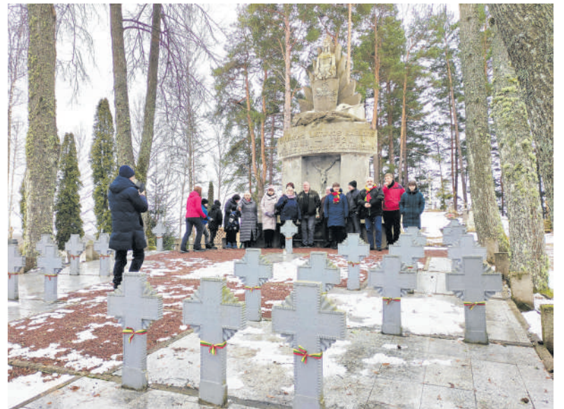
Žygio dalyviai pagerbė kovojusių už laisvę karių atminimą.