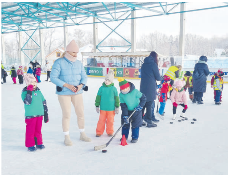
Vaikų veiduose buvo matyti susikaupimas.