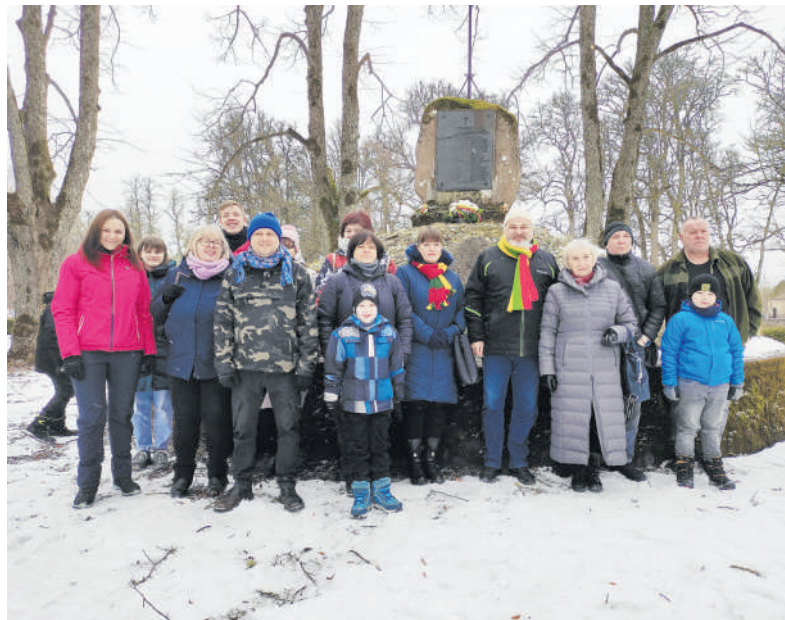
Autožygio dalyviai Aserėje prie paminklo Lietuvos ir Latvijos kariams.

„Prisiminti žuvusius Lietuvos karius, nuo bermontininkų ir bolševikų vadavusių ne tik Lie-