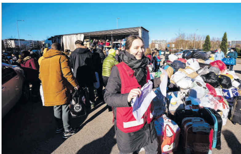
Teikti paramą daiktai, nesvarbu ar tai būtų drabužiai, higienos priemonės, ar dar kas nors, žmonėms patinka labiau, nes jie jaučia apčiuopiamesnę naudą.

Prasidėjus karui Rokiškis taip pat tapo atviras nuo karo siaubo bėgantiems ukrainiečiams. Jie buvo apgyvendinti Panemunėlio, Obelių bei Kriaunų seniūnijose. „Rokiškio Sirena“ duomenimis, per metus Rokiškio rajone gyveno apie 200 pabėgėlių iš Ukrainos. Daugiausia – moterys su vaikais. Pastarųjų amžius: nuo darželinuko iki 12-os klasės moksleivio. Pagal galiojančius Lietuvos respublikos įstatymus